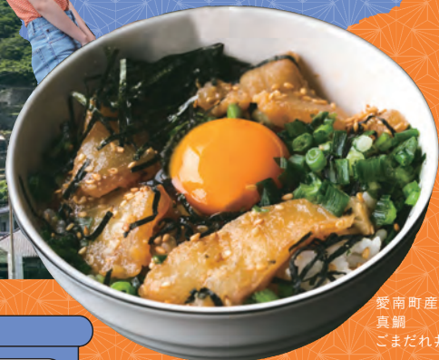
愛南町産 真鯛 ごまだれ丼