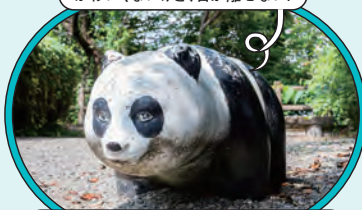
ば ぜ や ま 馬瀬山公園