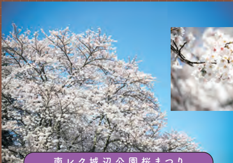
南レク城辺公園桜まつり