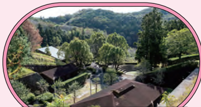
● 南レク大森山公園キャンプ場 ●

◎ 鹿島 ☎ 0895-82-1111(愛南町役場西海支所) ◎ 鹿島への渡船がある7月中頃～8月末