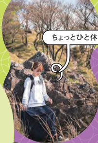
ちよっとひと休み

◎ 正木3047 ☎ 0895-84-2211 (愛南町役場一本松支所) ☺ 土日のみ運営9:00~16:30