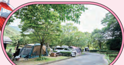
● グリーンパークすのかわオートキャンプ場 ●