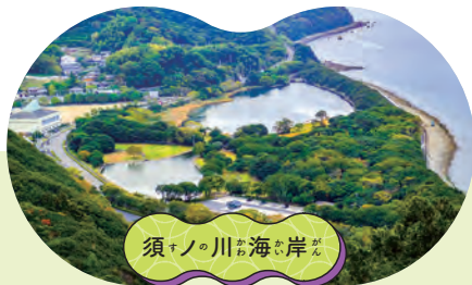
須ノ川の海ぶき岸