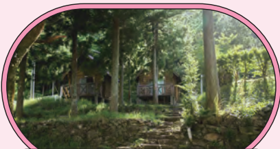
● 山出憩いの里温泉キャンプ場 ●

◎ 須ノ川61 ☎ 0895-85-1000(グリーンパークすのかわ管理事務所) ◎ 4月～10月 チェックイン/15:00よりチェックアウト/翌日13:00まで。デイキャンプは、10:00～16:00まで