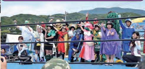
ぎゅぎゅっと愛南!夏の陣~海と山を喰らう~