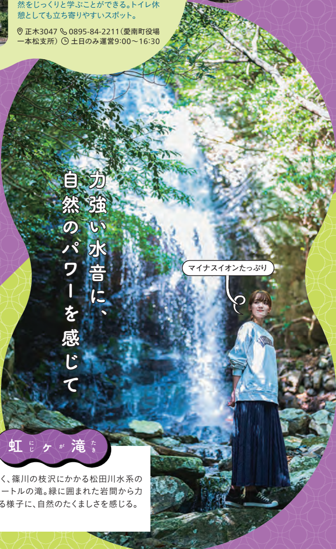
マイナスイオンたっぷり