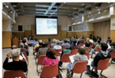
▲住民説明会には約50人が参加しました

審査の過程や事業化の際の条件整理によって内容は変わりますが、今回は、説明会で説明した企画提案書の内容を紹介します。