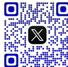
X (旧Twitter) QRコード