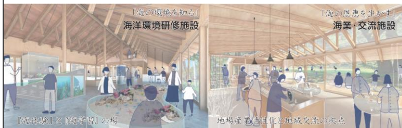
「海体験」と「海学習」の場