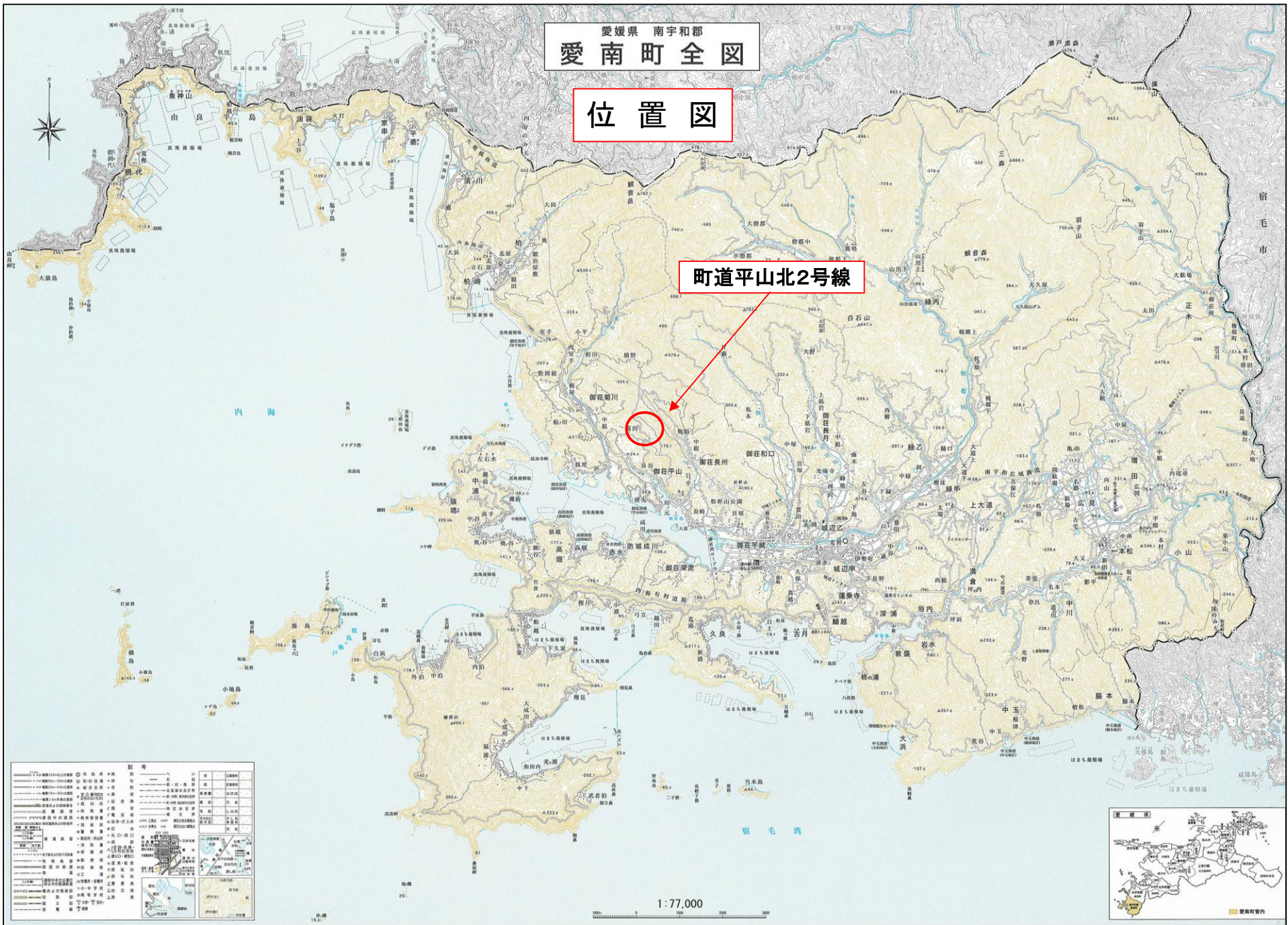
「この地図は、国土地理院長の承認を得て、同院発行の7万7千分の1地形図を複製したものである。(承認番号 平16四複 第57号)」を加工したものである。」