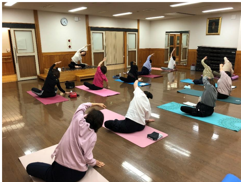
令和5年5月23日に開催した健康づくり「ヨガ」教室