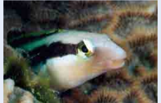
キクメイシに住むクロスジギンポ

キクメイシも愛南町に多く生息しているサンゴの仲間である。漢字では「菊目石」と書く。模様が菊の花に似ていて、石のように硬いことから、この名前がついた。前号で紹介したミドリイシの仲間よりも成長が遅く、岩のような塊になって成長する。見慣れないとサンゴと分らないかもしれない。