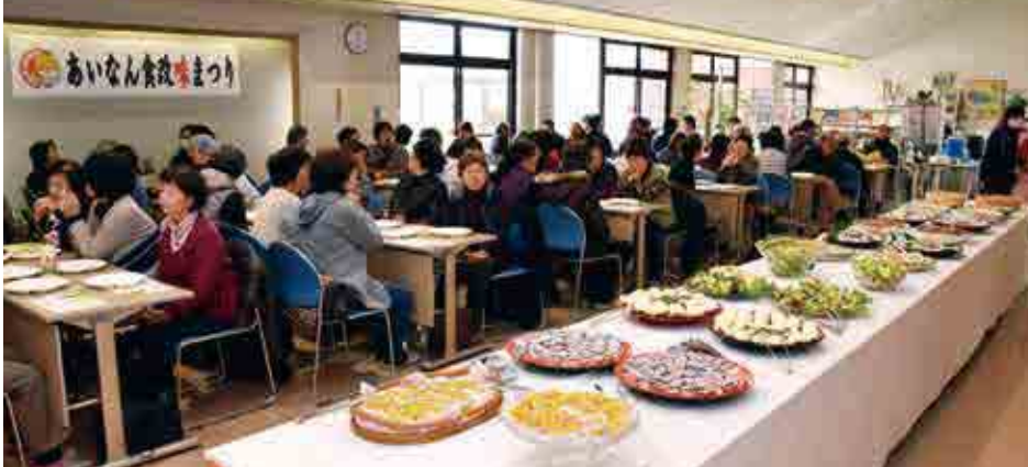
1月に開催された味まつりでは、栄養バランスを考慮したメニューが参加者にふるまわれました

もの。日々の食生活を改善して、皆さんには健康的に暮らしていただきたい」と話しました。