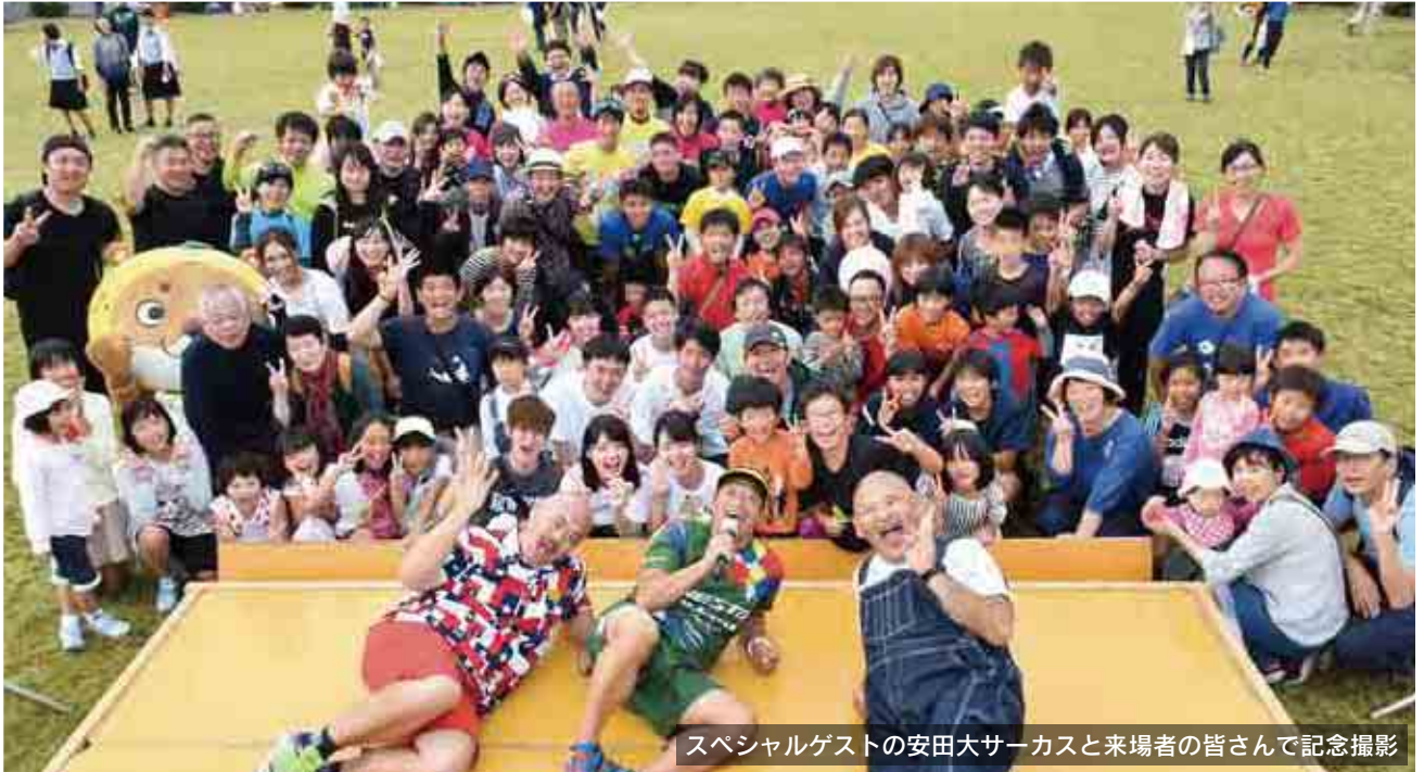
スペシャルゲストの安田大サーカスと来場者の皆さんで記念撮影