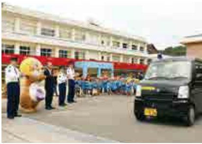
あいなん幼稚園の園児らに見送られて防犯パトロールに出発する青パト隊員

国地域安全運動(10月11日～20日)が開催され、青パトによる防犯パトロールや防犯ボランティアによる犯罪被害防止の広報活動が行われました。