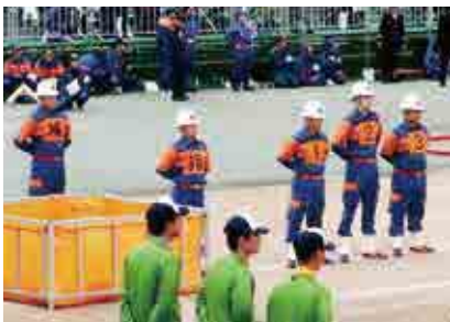
富山市で行われた全国消防操法大会。小雨の中、開始の合図を待つ選手たち

上位入賞はかないませんでした。5人の選手は日々の訓練成果を発揮し、素晴らしい操法を披露しました。