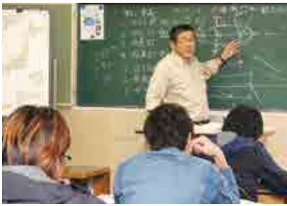
船舶職員養成訓練に参加し、4・5級の海技士を目指して研修を続ける受講生

船舶職員養成訓練が行われています。同訓練は、昭和26年から西海地域で実施され、これまで漁業や海運業界に多くの人材を送り出してきました。