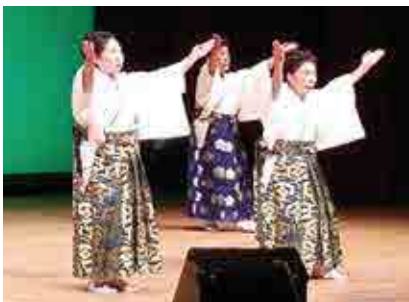
福浦鶴寿会による日本舞踊「霊峰富士」がカラオケ大会のオープニングを飾りました

福浦鶴寿会の日本舞踊を皮切りに、会員から選ばれた30名が次々と自慢の歌声を披露、2時間にわたって会場を盛り上げました。大会終了後は「お楽しみ抽選会」が盛大に行われました。