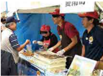
愛南ゴールドジュースやじゃやこ天の販売を通して、来場客に愛南町をPRしました

愛南ゴールド果汁100%のジュースやじゃやこ天、カワハギの串揚げなどの販売をしたり、なしくんがオリジナルグッズを配って来場客に愛南町をPRしました。