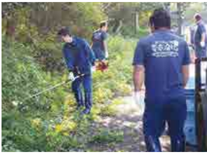
台風24号が通過したあと、道路の清掃活動を行う愛南漁協の職員

同漁協では定期的にボランティア清掃を行っています。この日は、地域住民も清掃に加わり、ボランティアの輪が広がりました。