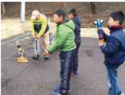
完成したロケットを飛ばす参加者

今回は、ペットボトルロケット作りに挑戦。完成したロケットの中には100mも飛んだロケットがあり、ロケットが発射台から勢いよく飛んでいく度に、子どもたちからは大きな歓声が上がりました。