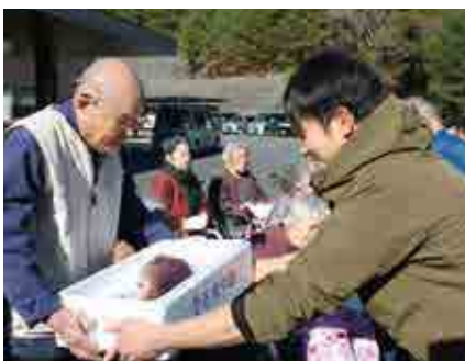
真鯛を手渡す地域おこし協力隊員（右）

自在園では、地域おこし協力隊員らから真鯛11尾、ブリ2本が入所者に手渡しされ、入所者は「毎年楽しみにしている」と笑顔を見せました。