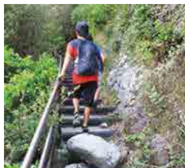
探検調査を行う児童。避難経路に危険な箇所があることに気づきました