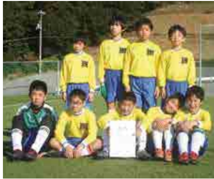
1部準優勝 緑スポーツ少年団