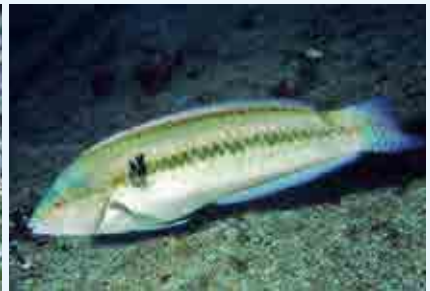
キュウセン：中国語で猪

2月になってしまったが、今年の干支にちなんで、名前に猪の付いた魚を紹介したい。ミナミゴンベは、その顔が猪に似ていることから英語で、「Boar hawk fish」(Boar 猪、hawk 鷹、fish 魚)と呼ばれている。赤い模様が美しい5cm程の小さな魚で、岩の上にチョココンと乗っている姿をよく見かける。動きが素早いことから鷹という意味の単語も入っている。漢字にすると猪鷹魚というところだろうか。