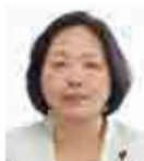
のりこ 金繁典子 議員