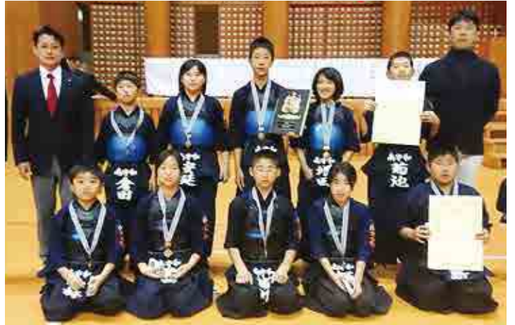
優勝した南宇和剣道会A(後列)と3位入賞の南宇和剣道会B

南宇和剣道会Aは、3月に山口県で行われる第41回全国スポーツ少年団剣道交流大会に出場します。