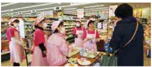
食改による「野菜1日350g」の啓発活動