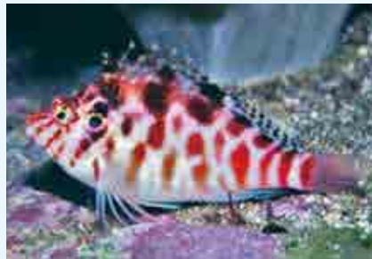
ミナミゴンベ：英語で猪