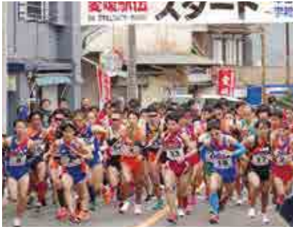
午前10時の号砲で一斉にスタートする選手

選手は、午前10時に一本松バス停留所付近をスタート。ゴール目指して懸命にたすきを繋ぎました。町内から2部に出場した愛南体協は3時間22分3秒で17位でした。