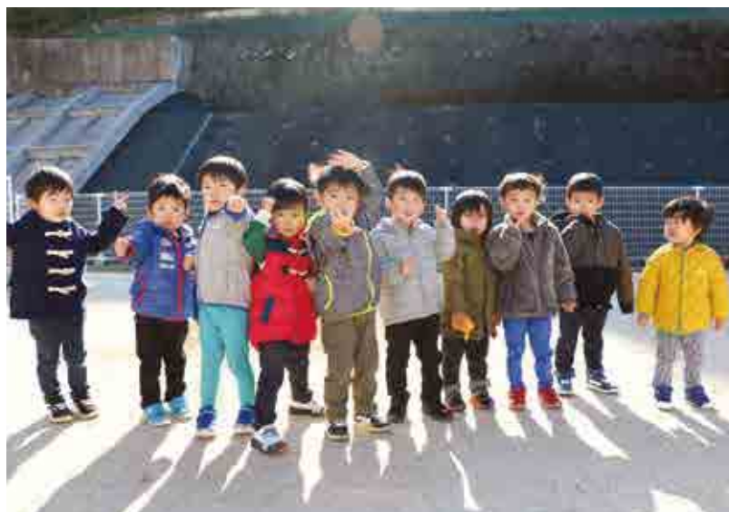
●はまゆう乳幼児保育所 さくら組 男の子 パワー全開!! 寒さなんかには負けないよ。