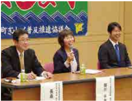
ぎよしよく教育の展開を議論するパネリスト

荘文化センターで「第9回愛南町水産フォーラム」が開催され、行政・教育・水産関係者など約100人が参加して、町内外で実践されているぎよしよく教育のこれまでの取組や実績に関する発表に耳を傾けました。総合討論では、ぎよしよく教育の今後の展開について来場者を交えて議論が行われました。