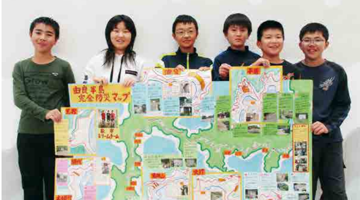
家串ドリームチーム