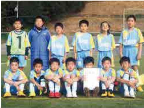
1部優勝 城辺少年サッカークラブ