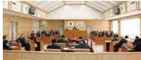
平成30年第4回議会定例会

初日には、3人の議員が一般質問を行い、最終日には、補正予算、条例改正等についても審議・可決しました。