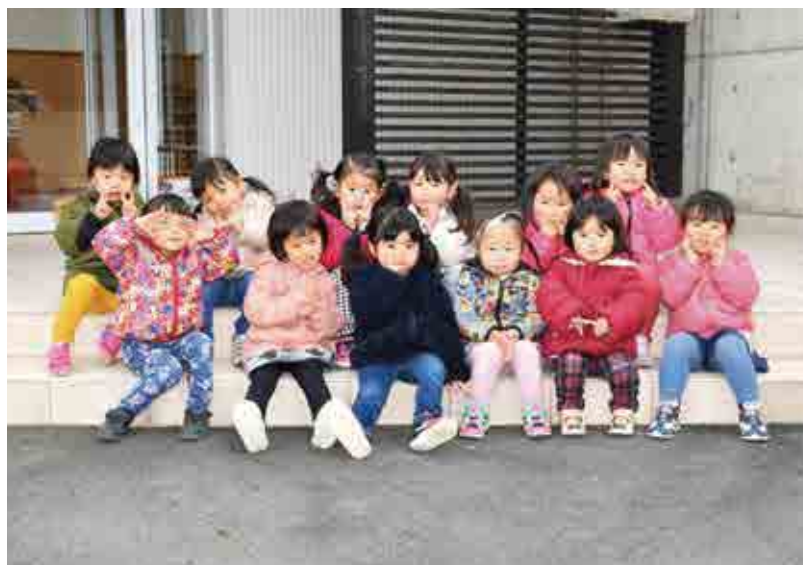
●はまゆう乳幼児保育所 さくら組 女の子 プリキュアポーズで はい、チーズ!!