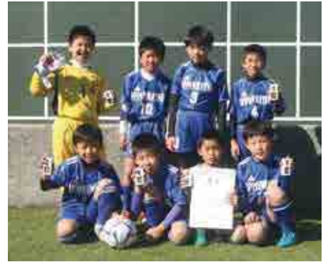
2部優勝 一本松少年サッカークラブ