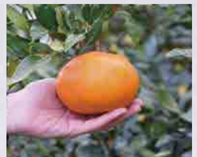
▲手のひらサイズに大きく成長した甘平。しっかりとした食べ応えと上品な甘さが特徴です。

甘平の柑橘としての特徴はその甘さと食感。食べた方からの評判も良く、「こんなの初めて食べたと言われる」と手応えを感じています。「私が農業を初めたのが最近なので、まずは良い樹木に育つようにこだわって育てたい」と今後の展望を見据えました。