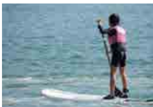
SUPを楽しむクラブ員

▶年会費 1名 5,000円 (研修事業等に参加する場合、随時参加費を徴収します)