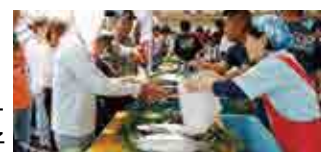
昨年のカツオ販売の様子

愛南町の魅力をぎゅぎゅっと詰め込んだ楽しいイベントです。お誘い合わせのうえ、ぜひともお越しください。