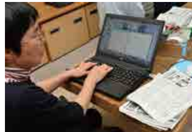
紙面を見ながらパソコンに入力。専用の点訳ソフトを使います。