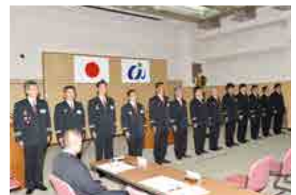
令和元年度愛南町消防団本部役員の皆さん