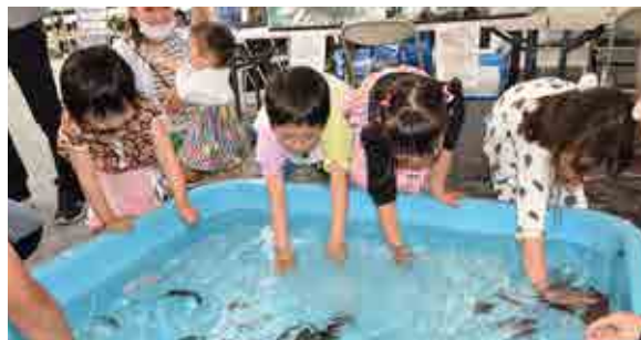
南水研のタッチプールでは子どもが魚とふれあう