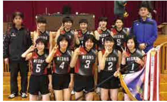
優勝した御荘中・城辺中（合同）の皆さん

町内外から計6チームが参加して熱戦が繰り広げられ、御荘中・城辺中（合同）が初優勝を果たしました。