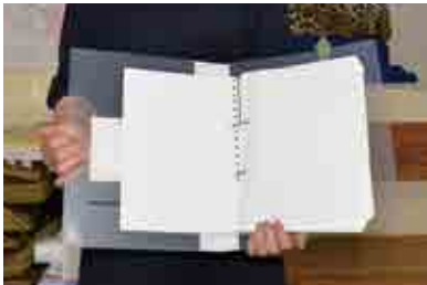
点字となった広報あいなんが完成。必要としている方に届けます。