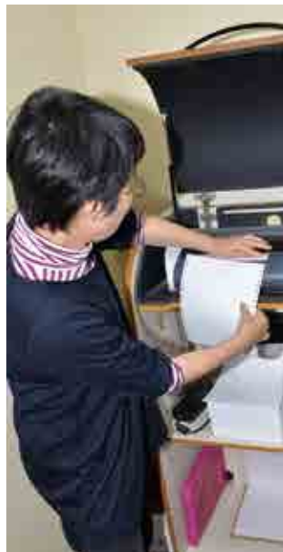
専用プリンタで印刷します。