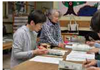
担当するページの分担を決めます。