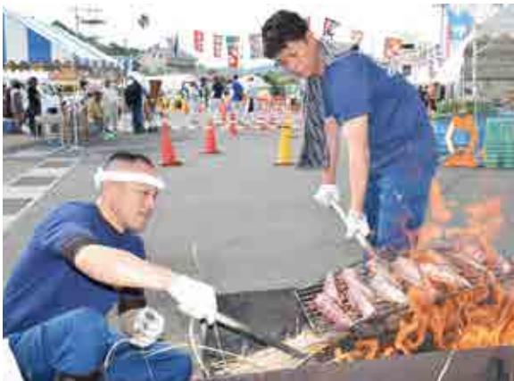
わらで豪快に焼くタタキは香ばしくて絶品