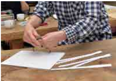
用紙を紐でとじて製本します。