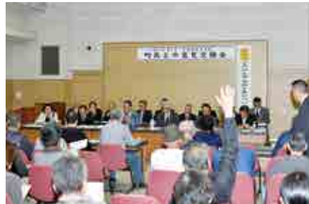
積極的に質問する参加者ら

参加者からは、県内の他自治体と比較した場合の愛南町の財政状況を問う質問などが挙がり、それに対して議員が回答し、意見交換を行いました。