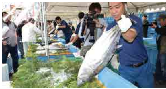
前日に深浦漁港に水揚げされたカツオを一本売り