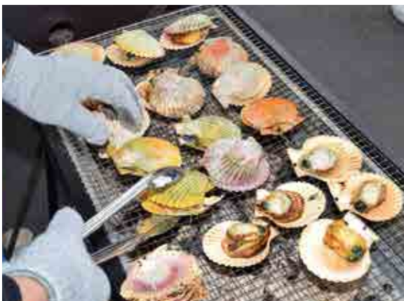
ヒオウギ貝の浜焼きは甘味があって濃厚