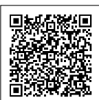
愛南町ホームページ

※保険料が納め忘れの状態、万一、障がいや死亡といった不慮の事態が発生すると、障害基礎年金や遺族基礎年金が受けられない場合があります。