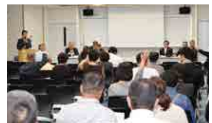
役場本庁で行われた説明会の様子

町では、本説明会でお聞きした貴重なご意見を今後の検討材料とし、慎重に議論を進めていきます。