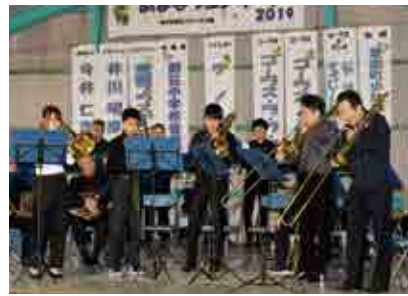
迫力のある演奏を披露する 愛媛プラスアンサンブル