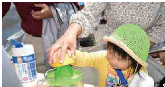
愛南ゴールドのジュース搾りは子どもに大人気