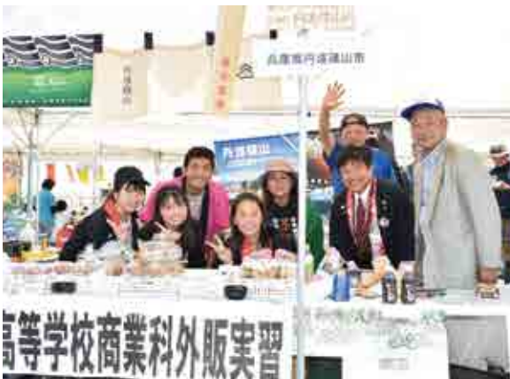
姉妹都市・丹波篠山市から出店いただいた皆さん