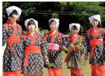
お田植え祭りに参加した 柏小5・6年女子児童の皆さん