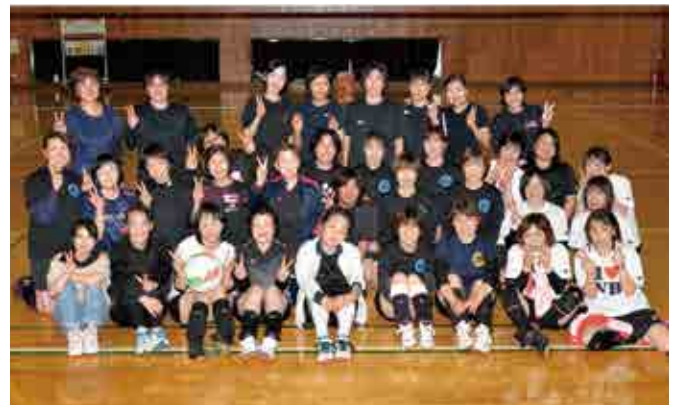
大会に出場した皆さん