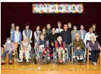
川柳を通じて交流した南楽荘入所者と城辺川柳会の皆さん

入所者からは、「良い結果がとれて良かった」、「また交流したい」といった声が聞かれ、城辺川柳会からは、「入所者の方の活力になれば幸いです」という感想が述べられました。