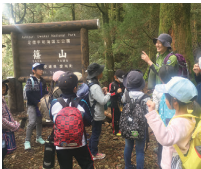
自然保護官から篠山について学びながら頂上を目指す参加者

道中では環境省自然保護官が出題する篠山に関するクイズに挑戦し、篠山について学習しました。約1時間かけて頂上に到着した参加者は、山頂から見渡す景色に歓声を上げ、「登るのは大変だったけど、頂上からの景色はすごくきれいだった」などの感想を述べていました。