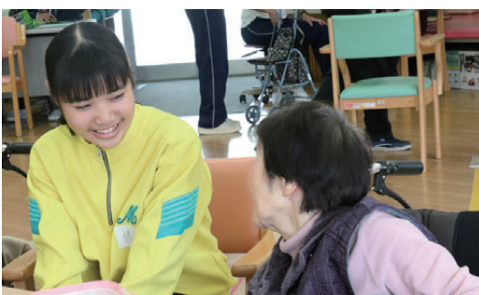
なんぐん館の利用者と触れ合って理解を深める御荘中の生徒

御荘中学校2年生47人が町内6カ所の高齢者福祉施設を訪問し、施設の見学や入所者との交流、各施設職員を講師とした「認知症サポーター(ジュニアサポーター)養成講座」の受講などを行いました。