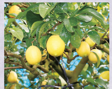
▲12月ごろに旬を迎えたレモンが収穫時期を迎えたわに実っています。