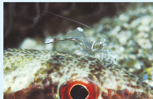
【クリーニングをするアカホシカクレエビ】

愛南の海にも多くのエビが住んでいる。その中で、アカホシカクレエビを紹介したい。このエビは、ドクターシュリンプとも呼ばれている。その理由は、魚に付いた寄生虫や病気になった皮膚を食べるからだ。名前の通り、魚のお医者さんである。魚は体の手入れをしてもらい、エビは食べ物にありつけるウィンウィンの関係にある。