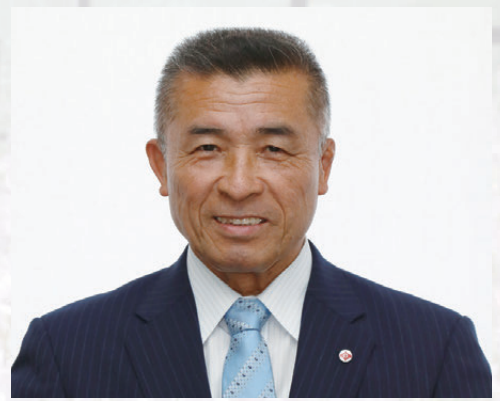
愛南町長 清水 雅文 まさふみ