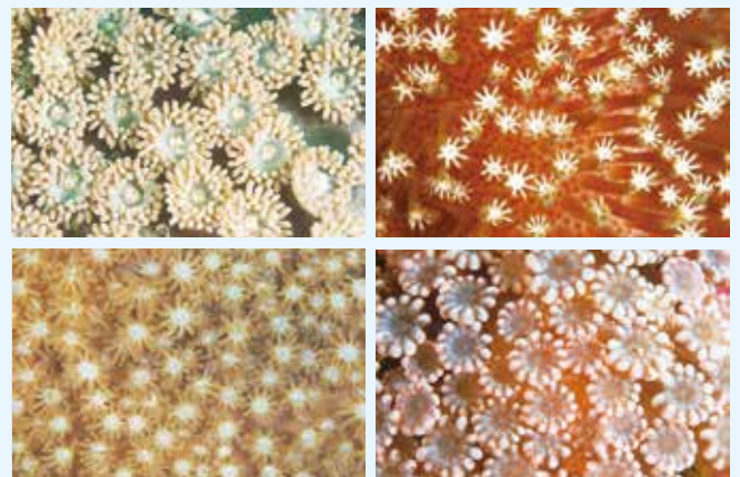
【花のようなサンゴのポリプ】

サンゴは動かないために植物の仲間だと思っている人が多いが、実は動物の仲間だ。ポリプの中心には口があり、花びらのように見える触