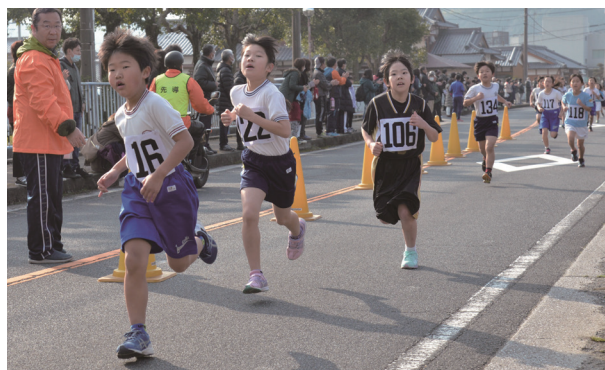
競り合う選手たち