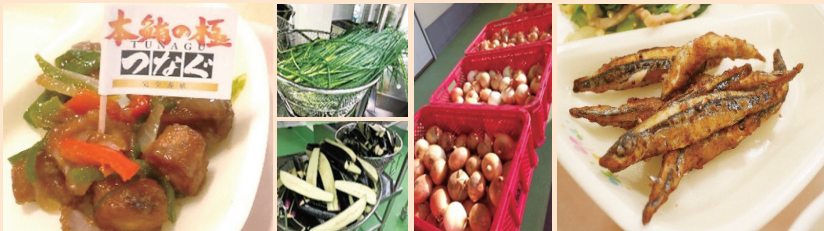
愛南町で完全養殖されたクロマグロを使用した「キビナゴのから揚げ」 「クロマグロと野菜の揚げ照り煮」 <学校給食センターの献立より>

愛南町学校給食センターでは、地元の業者と連携して、愛南町産の野菜や海産物の活用を推進しています。その日の献立に登場する愛南町産の食材に関する話題を、各学校の給食の時間の放送で流したり、ポスターを作成して配布したり、栄養教諭が学校を訪れて、直接指導したりすることで、児童生徒は地元で取れる食材への学びを深めています。