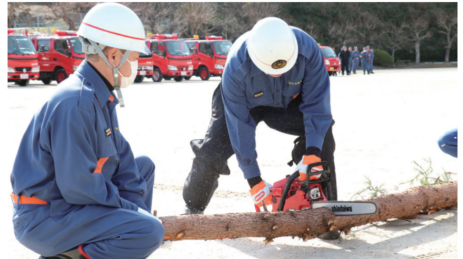
チェーンソーで倒木を切断し撤去