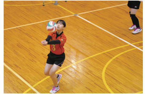
好プレーを披露する選手たち