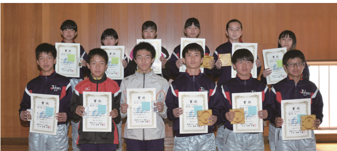
中学2年生男女の第1位～第6位