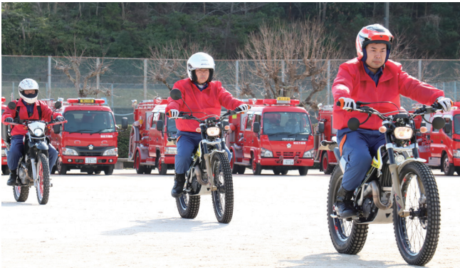
出動するバイク隊