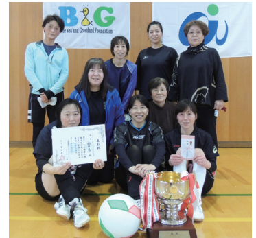
優勝した向日葵の皆さん