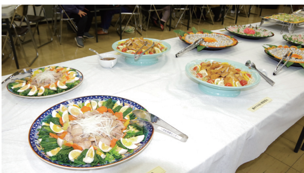
食改味まつりに用意された栄養バランスのとれた料理

西海町民会館3階ホールで「令和元年度あいなん食改味まつり」（愛南町食生活改善推進協議会主催）が開催され、91人が来場しました。