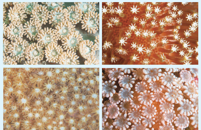
【花のようなサンゴのポリプ】

サンゴは動かないために植物の仲間だと思っている人が多いが、実は動物の仲間だ。ポリプの中心には口があり、花びらのように見える触