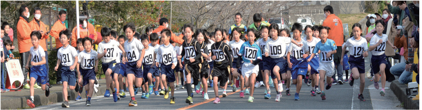
力強く走り出す小学2年生男女