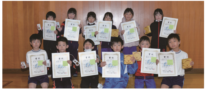
小学1年生男女の第1位～第6位