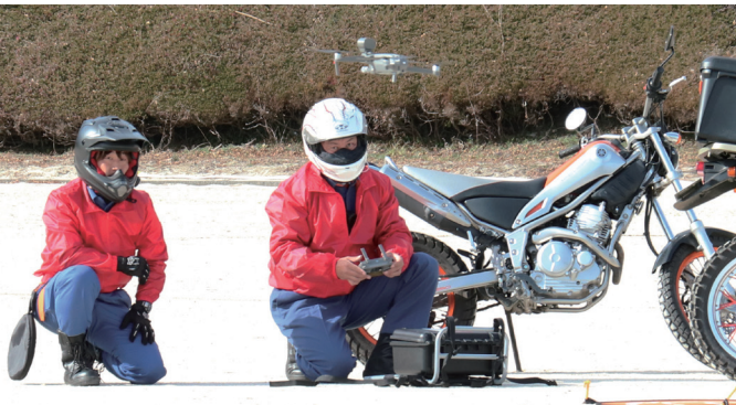
ドローンを飛ばし災害現場を確認