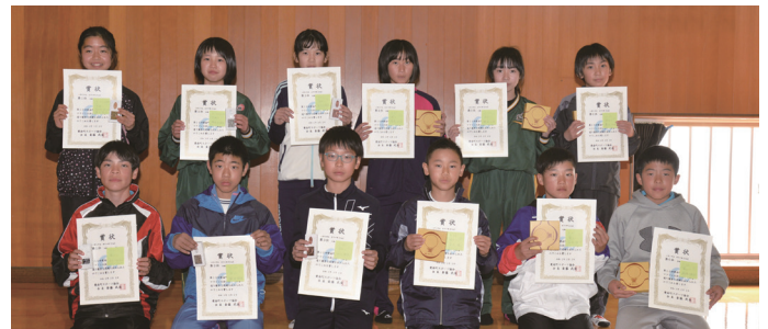
小学5年生男女の第1位～第6位