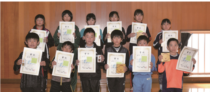
小学4年生男女の第1位～第6位