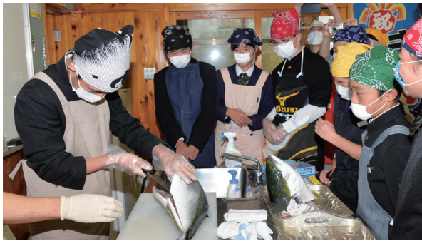
町水産課の職員に切り方を教わりながら、養殖ブリの三枚おろしに挑戦