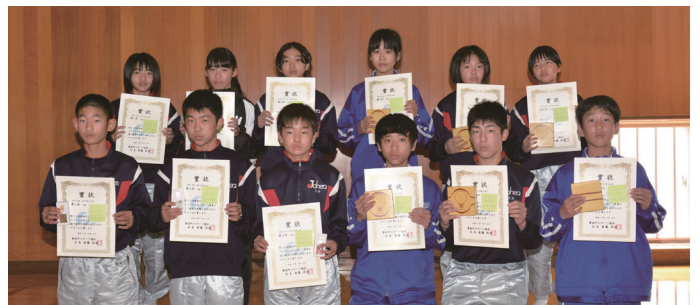
中学1年生男女の第1位～第6位