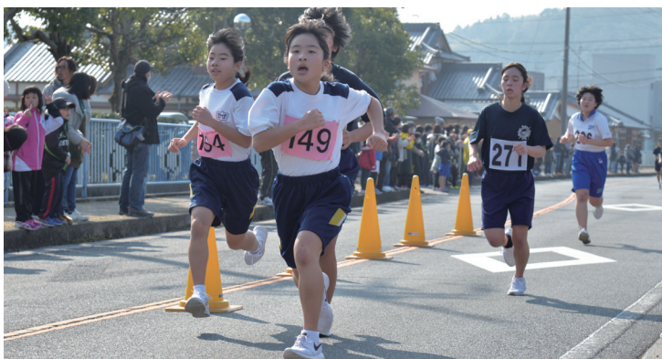
ゴールを目指して懸命に走る選手