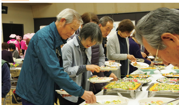
いろいろな料理に目移りしてしまう参加者の皆さん