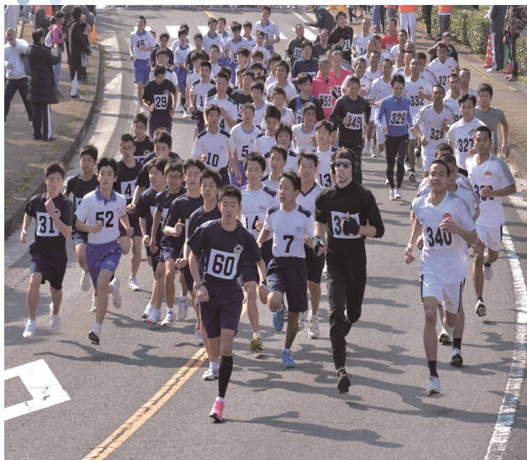
一斉にスタートを切る中学生・一般男子