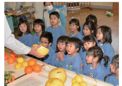
輪切りにしたかんきつを見て驚く園児