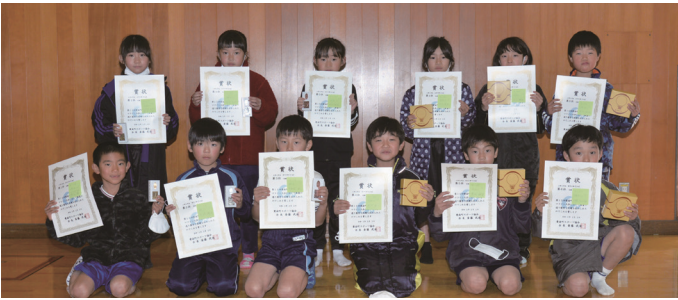
小学2年生男女の第1位～第6位