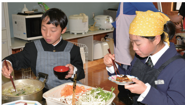
自ら調理したブリしゃぶやブリの照り焼きなどを味わう篠山中の生徒

地元で養殖されている魚や水産業に興味を持ってもらおうと、1月23日(木)にぎょしょく出前授業が篠山中学校であり、1年生から3年生の生徒11人や教職員が参加して養殖ブリの調理実習を行いました。