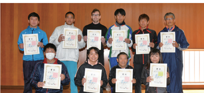
高校生・一般(A～C)男女の第3位以内