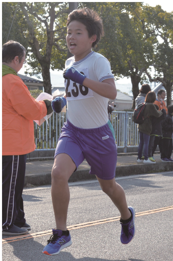
軽快な走りを披露