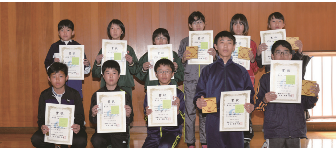
小学6年生男女の第1位～第6位