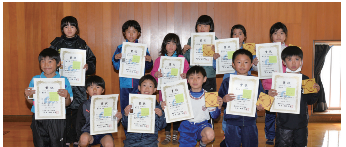
小学3年生男女の第1位～第6位