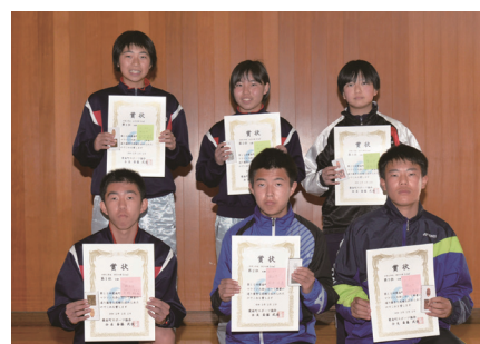
中学3年生男女の第1位～第3位