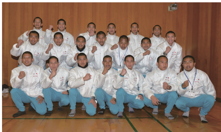
インドネシアの漁業技能実習生も大勢参加