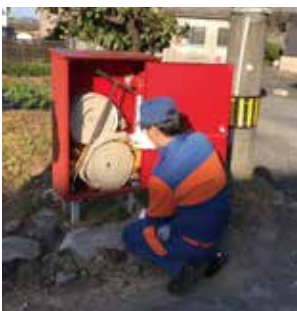
火災に備えて器具点検を行う消防団員