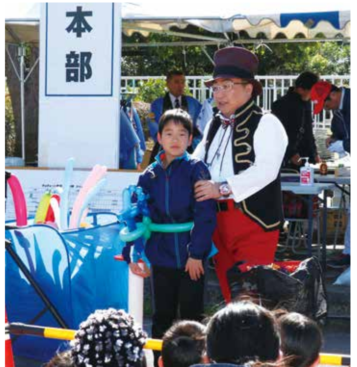
風船王子がバルーンアートで会場を盛り上げました