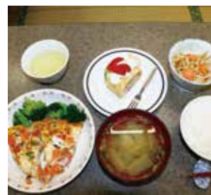
実習で調理されたバランスの取れた食事