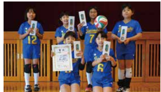
2部準優勝 一本松バレーボールクラブ B