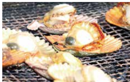
ヒオウギ貝の浜焼き