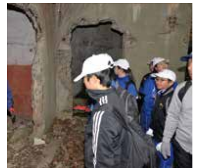
聴音作業が行われていた建物跡などを見学