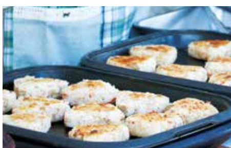
鯛めし焼おにぎり