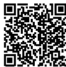
愛南町 ホーム ページ