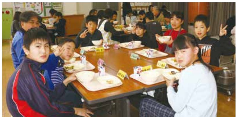
媛っこ地鶏を使った親子丼をおいしそうに食べる児童

児童は、「親子丼がおいしかった。このお肉が近くで育てられていることにびっくりした」と感想を述べました。