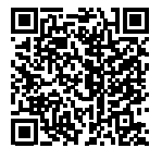
愛南町 ホーム ページ