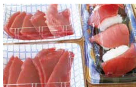
マグロの刺し身と握り