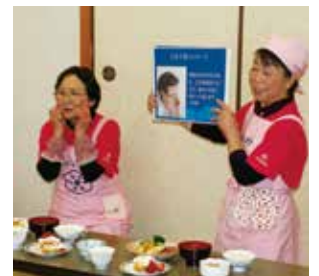
食事前の口腔体操を実演する会員