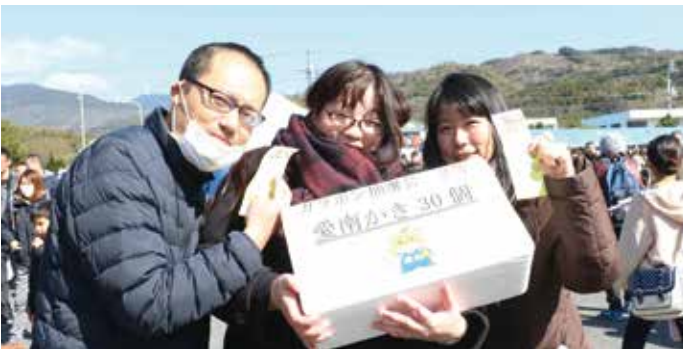
抽選会では多くの方にかきなどの景品が当たりました