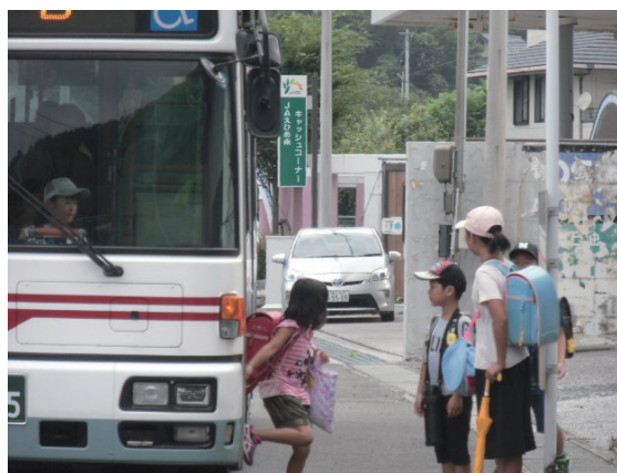
「気をつけて朝の通学児童」 山本 英三(柏) えいぞう