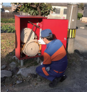
火災に備えて器具点検を行う消防団員