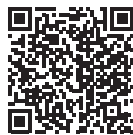
愛南町 ホーム ページ