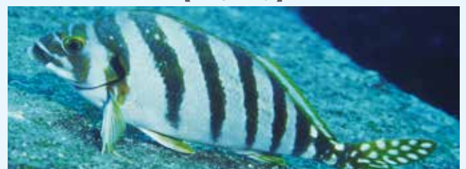
【ヒダリマキ(タカノハダイ)】

を付けたという説がある。さらに最近になって、ミギマキにはミギマキ、ヒダリマキにはタカノハダイという標準和名が付いた。