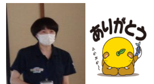
保健師・栄養士の皆さん