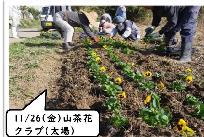
11/26(金)山茶花クラブ(太場)