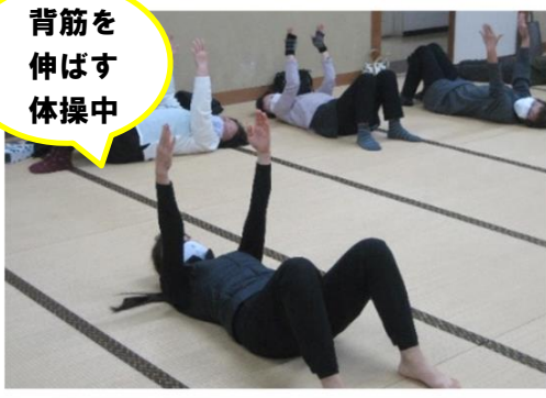
背筋を伸ばす体操中