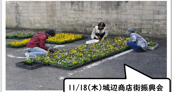
11/18(木)城辺商店街振興会