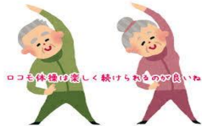
ロコモ体操は楽しく続けられるのが良いね

12月6日(月)深浦公民館で高齢者を対象としたロコモ健康体操が行われました。この体操は、加齢などによる運動能力の低下を防ぐための体操で、この日は10名が参加して背筋を伸ばすことをメインにした運動でゆっくりと体をほぐしていきました。参加者は講師の説明にうなずきながらすべてのメニューをこなし、終わる頃には「体がポカポカしてきた。」といった声も聞かれ、代謝が上がったことを実感できたようでした。