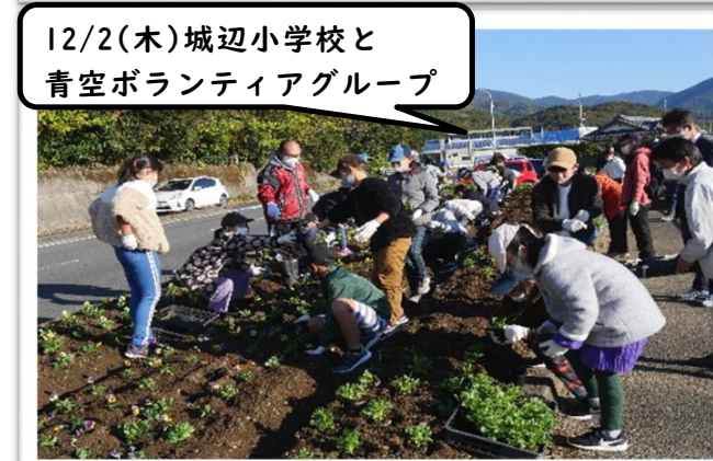
12/2(木)城辺小学校と青空ボランティアグループ