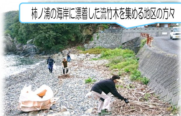
柿ノ浦の海岸に漂着した流竹木を集める地区の方々