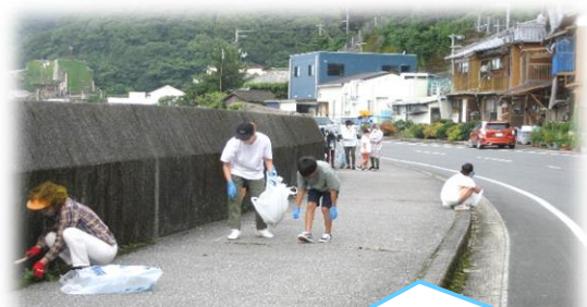
ゴミ拾いをする参加者たち

7/18(月)の「海の日」に、公民館前を中心に約2kmの海岸沿いを朝6時から一時間半程度、地域の方々が参加して清掃活動を行いました。中には、家族3世代で楽しみながらごみを拾っている姿もみられました。児童のみなさんは、夏休み前のボランティア活動として参加してくれました。