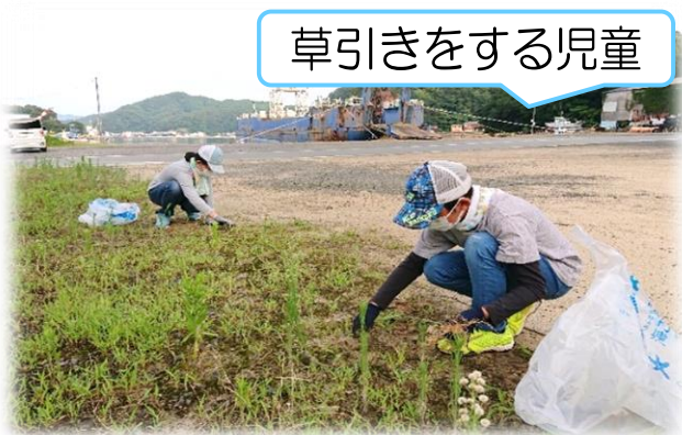
草引きをする児童

7/18(月)の「海の日」に、大浜、柿ノ浦、敦盛、岩水、垣内、満倉の6地区の沿道及び海岸線で清掃活動が行われました。この活動には、地域の一員として、地元の城辺小学校児童と城辺中学校生徒も参加し、生活環境美化に汗を流しました。ゴミ袋にして166袋、重さにして725kgものゴミを環境衛生センターへ搬入しました。また、柿ノ浦の海岸へ漂着したフレコンバック(1m 3 )3袋分の流竹木の最終処理については、役場の環境衛生課へお願いしました。