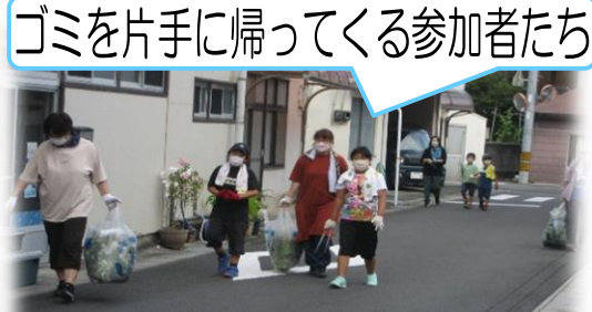
ゴミを片手に帰ってくる参加者たち