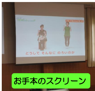
お手本のスクリーン