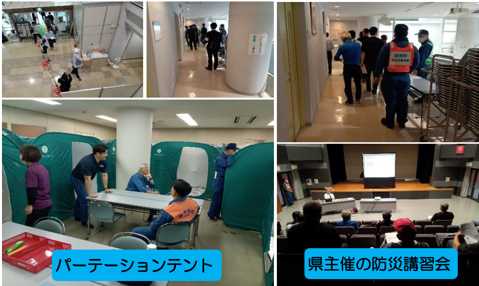
パーティションテント