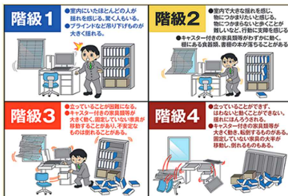
長周期地震動階級

長周期地震動階級とは、高層ビルにおける、地震時の人の行動の困難さの程度や、家具や什器の移動・転倒などの被害の程度から4つの段階に区分した揺れの大きさの指標です。