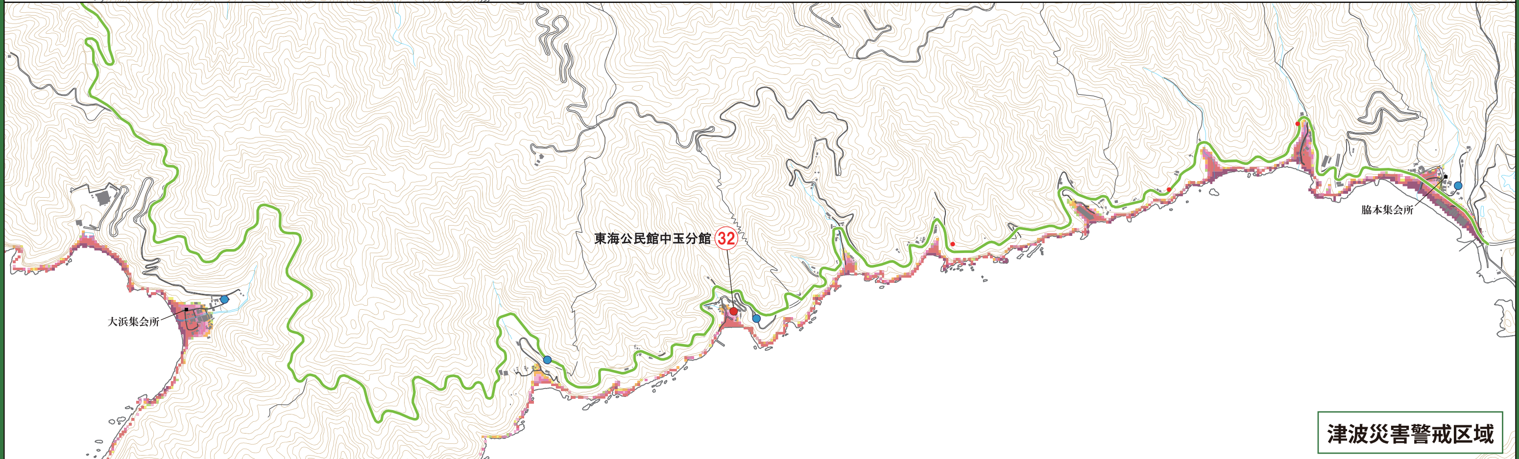
津波災害警戒区域