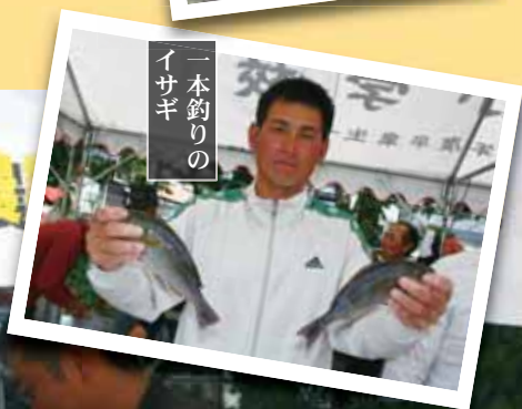
一本釣りのイサギ