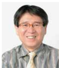
講師の森田正光 まさみつ さん