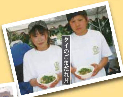
タイのごまだれ丼