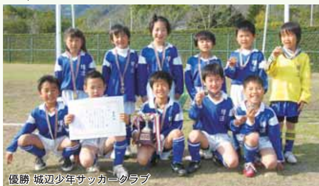
優勝 城辺少年サッカークラブ

宇和島市津島町の南レクファミリパークで開催された「第8回南レクわんぱくサッカー大会」（3年生以下）で、城辺少年サッカークラブが、見事、優勝を果たしました。おめでとうございます。