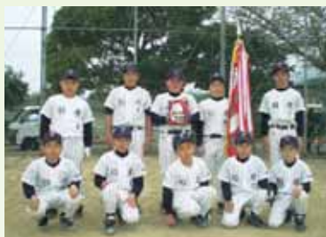
1位 船越スポーツ少年団