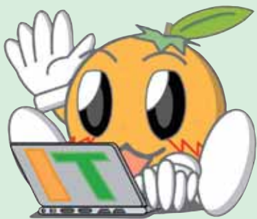
えひめITフェア イメージキャラクター あいっとちゃん

地デジ、ブロードバンド等、最新の IT機器に触れたり、相撲ロボットの 操作体験、ケータイメールオークシヨ ンなど、家族で楽しめる催し「えひめ ITフェア2008」が、次のとおり 開催されます。