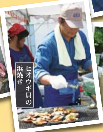
ヒオウギ貝の浜焼き