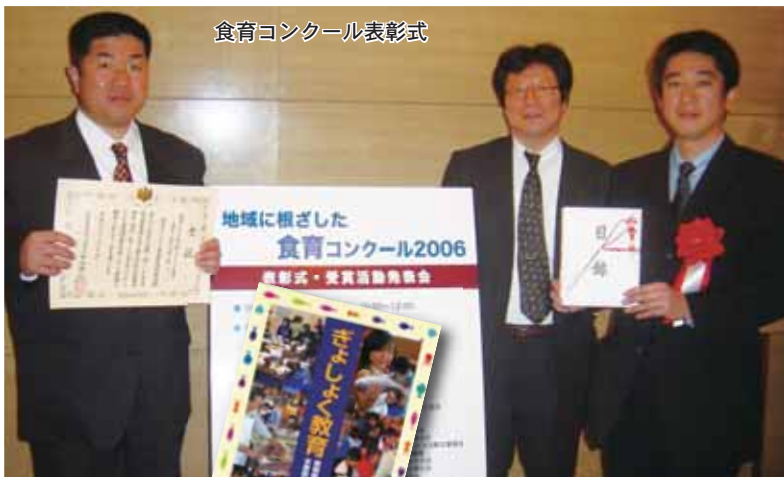
食育コンクール表彰式

【愛南町への思い】私は「一期一会」の言葉を大切にしており、愛南町の皆さんと共に語らいながら、様々な取り組みを進めたいと思います。愛南町と私のおつきあいは町の合併当初からで、町の依頼（愛南かつおフェアのマーケティング調査）で本格化しました。そして、3年前から、町内の幼・小学校や行政、漁協など水産業界、地域の団体からの温かい支援で、水産版食育の「ぎよしよく教育」を推進しています。「地域に根ざした食育コンクール2006」での優秀賞受賞の感激は忘れられません。また、今年5月には「愛媛県愛南町発」と題した『ぎよしよく教育』という本も刊行しました。当面、愛南町で中心となる私の仕事は、食育による地域活性化です。今秋より「愛なん食育プラン」（仮称、愛南町食育推進計画）の策定が予定されています。これには皆さんの絶大なる協力を得ながら、地域の視点から、住民の目線で健康福祉・教育・産業などの各分野で綿密な行動計画を立てて、愛南町の活性化につながるように全力投球したいと思います。皆さんのご支援をお願いして、挨拶とさせていただきます。