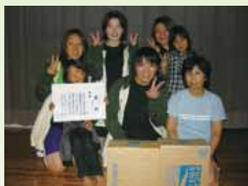
女子の部 1位 婆来団