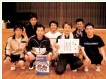
男子の部 1位 プチトマト