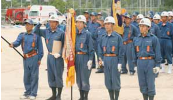
小型ポンプの部 1位の菊川支部の皆さん

あけほのグ ラウンドで 「第26回愛媛 県消防操法南 宇和地区大 会」が行わ れ、小型ポン プとポンプ車 の部に、各地 域の方面隊か ら10分団が出 場し、素早い 動作で放水の 速さを競い