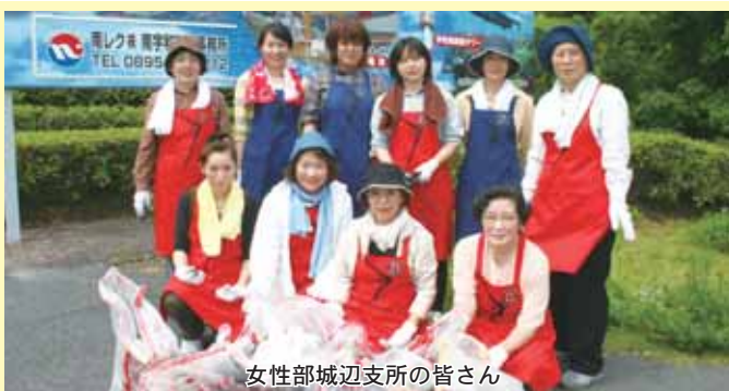
女性部城辺支所の皆さん

町商工会の各女性部が、各地区商店街を中心に、国道や町道に捨てられた空き缶やプラスチック類のごみを回収しました。この事業は「商工会の日」(6/10)を記念して、初めて行われたもので、参加者もごみの多さに驚いたようでした。今後も、商店街を思う心で、美化活動等、美しいまちづくりに貢献してほしいと思います。