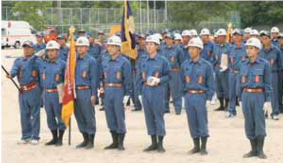
ポンプ自動車の部 1位の平城支部の皆さん