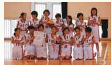
2位 平城スポーツ少年団ミニバスクラブ