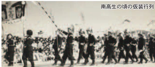
南高生の頃の仮装行列