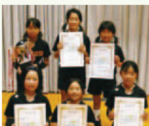
優勝（5年生以下）した一本松バレーボールクラブ