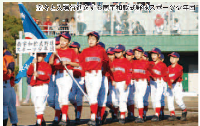
堂々と入場行進をする南宇和軟式野球スポーツ少年団