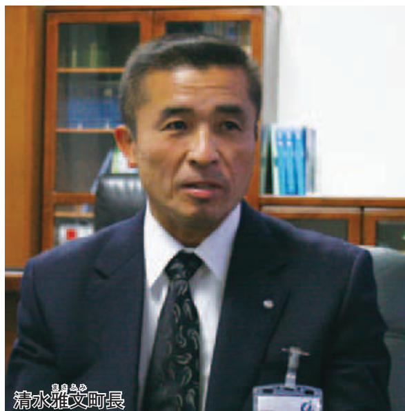
清水雅文 まろみ 町長

の施策は、町民のためになるのか」という視点で施策を立案してほしいと思っています。そんな職員を、年齢を問わず登用していきたいと考えていますし、若い職員のアイデアを活かせる弾力性のある行政組織をめざしていきたいと思いま