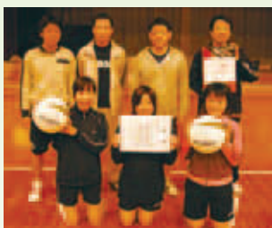
優勝 ミニキャロット