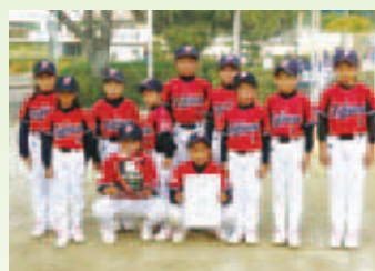
優勝した福浦スポーツ少年団