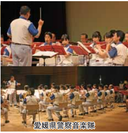
愛媛県警察音楽隊

最後に「被害届けをすぐに出す勇氣」「要求をきっぱり断る勇氣」「嫌がらせに絶対に負けない勇氣」を宣言し、暴力団などの反社会勢力に対し勇氣と誇りを持ち、町と住民が丸となって排除していくことを誓いました。