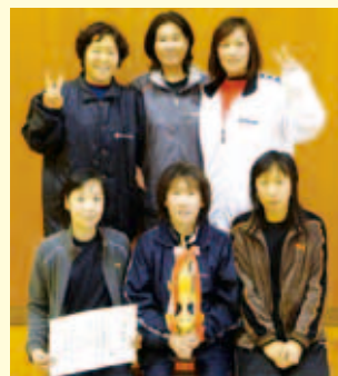
2部優勝 カルテット