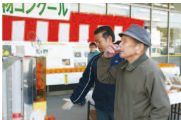
「愛南農産物コンクール」では、紫がかった濃赤色の果肉が特徴の「ブラッドオレンジ」の生搾りジュースの試飲も行われました。(3/3)【P7参照】