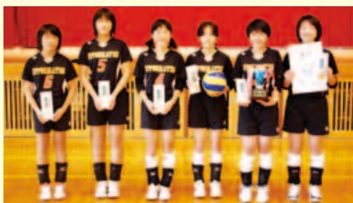
1部優勝 一本松 バレー ボール クラブA

【大会結果は次のとおり】 1部 優勝 一本松バレーボールクラブA、 準優勝 家串スポーツ少年団 3位 南宇和ジュニアバレーボールクラブA 2部 優勝 南宇和ジュニアバレーボールクラブB、 準優勝 一本松バレーボールクラブB