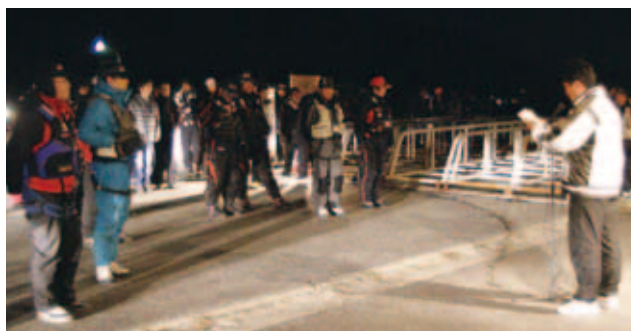
あいなん磯釣大会の開会式です。早朝の暗いうちから、町内外の「太公望」が福浦・中泊・柏地区に集いました。(2/26)【P18参照】