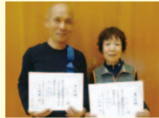
混合ダブルス 優勝 加洲・加洲ペア