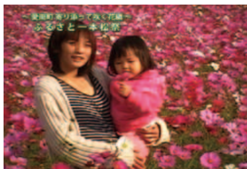
「ふるさとCM大賞えひめ‘11」で、伊予銀行賞を受賞した作品の1コマです。(2/20)【P18参照】