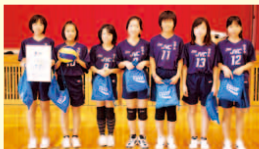
2部優勝 南宇和 ジュニア バレー ボール クラブB