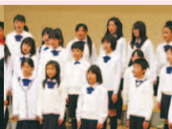
平城小学校音楽部