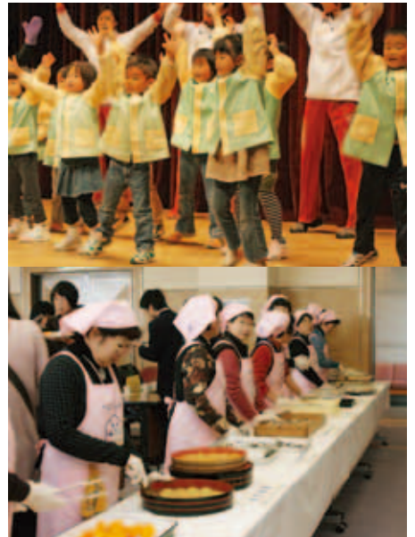
船越小学校食育成果発表の内容 (児童による家庭での料理体験)

らしい内容でした。 また、城辺保育所園児によ る、ノリノリの食育ダンスは、 見ている人の笑顔を誘い、食へ の関心を高めました。