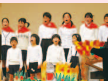
愛南町少年少女合唱団