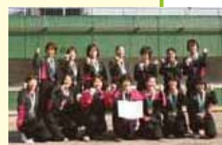
優秀団体賞 インティ御荘