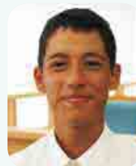
ショート コーリー 議員 篠山中学校

町長さんたちに、自分の考えを直接伝えることができ、とても光栄でした。議会の会場内の雰囲気は、静かで、声がよく通り、とてもすごいなと感じました。議会の様子や仕組みがよく分かり、とてもいい経験になりました。