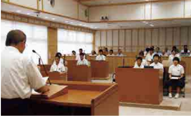
清水町長の答弁に熱心に耳を傾ける中高生議員