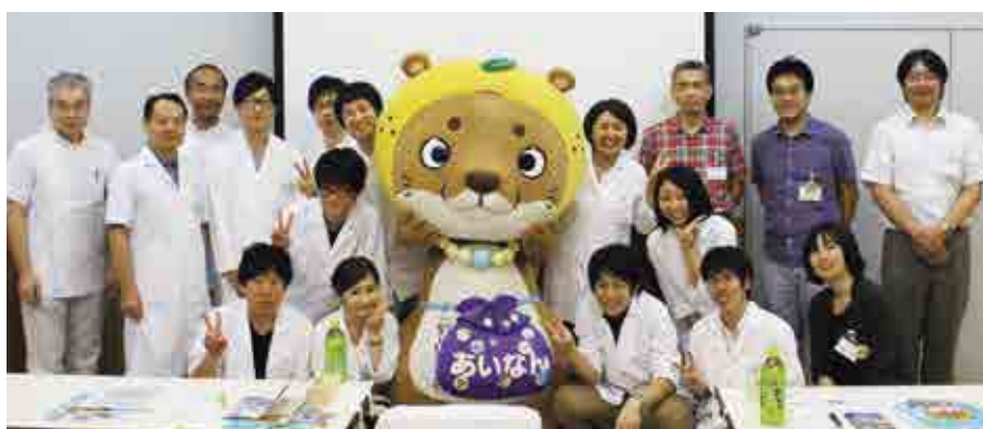
なーしくん登場で研修医大喜び！

また、夜の交流会では、南宇和郡医師会や地元団体、住民との親交を深めることができました。