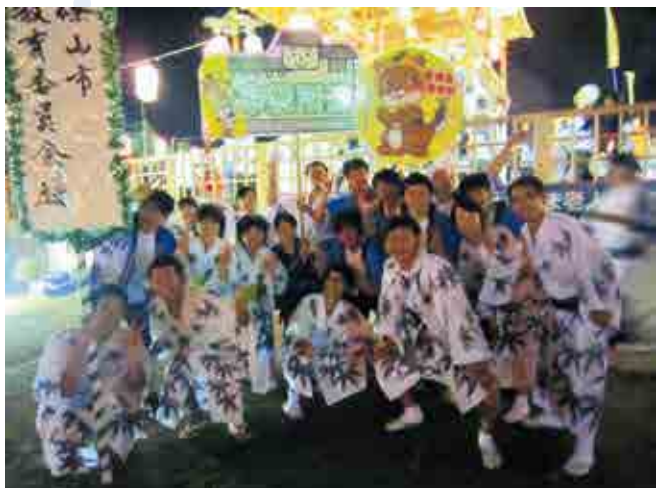
デカンショ祭りに参加して篠山市の方々と友好を深めました。

「高知県宿毛市愛媛県南宇和郡愛南町篠山小中学校組合立篠山小学校・中学校」がある縁から、平成24年1月17日、篠山市役所において「災害応急対策活動の相互応援に関する協定」を締結しました。それを機に、両市町のイベントへの出店や、相互の学校給食に特産物の提供を行うなど交流を深めてきました。