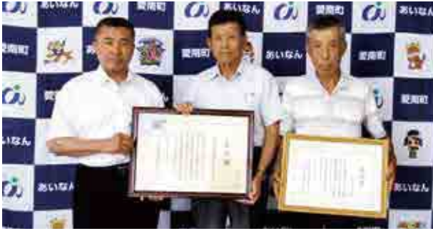
写真左から清水町長、倉田支部長、松崎さん