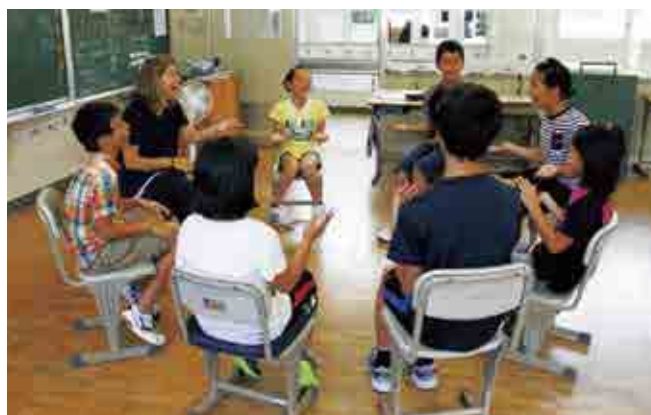
東海小学校での最後の授業

私の人生は次の章に移りますが、愛南町は私のふるさとなりました。ありがとう愛南! また逢う日まで。皆さん大好きです。