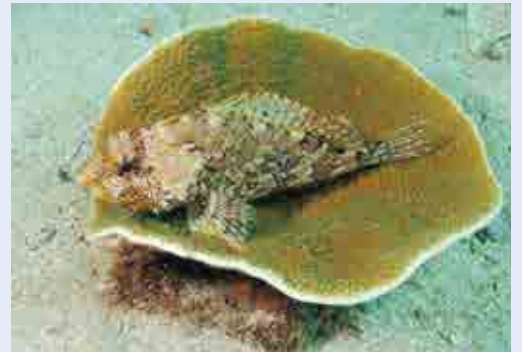
サンゴに隠れるカサゴ

9月1日は関東大震災にちなんだ防災の日である。各地で避難訓練など、様々な行事が行われている。地震が起こったら、どうすればよいかを考える一日にしたいものである。