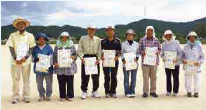
写真左から一般の部 船越愛球会・シニアの部 灘・グランドシニアの部 広見 C