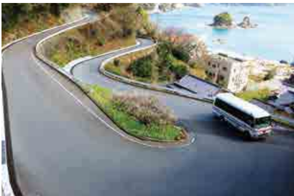
「梅香るヘアピンカーブ」