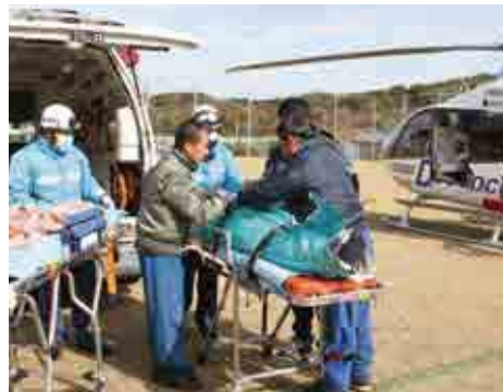
消防隊とヘリの乗務員が協力して傷病者をヘリに運びます

ドクターヘリは、愛媛県が運用する救急医療に必要な医療機器等を搭載したヘリコプターで、救急現場等に医師と看護師を派遣して速やかに初期治療を行い、医療機関へ搬送すること