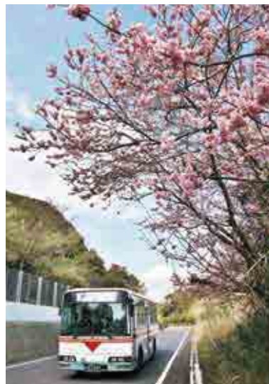
「ヒカンザクラの咲く頃」