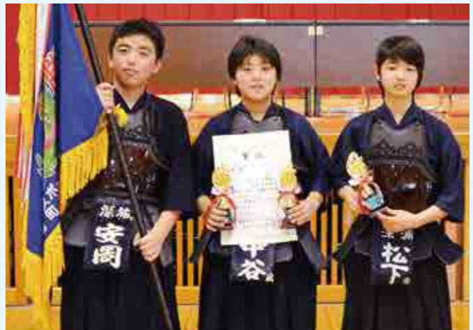
団体戦 高学年の部 優勝 深浦スポーツ少年団