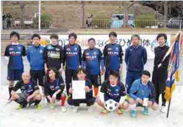
1部 優勝 JAM