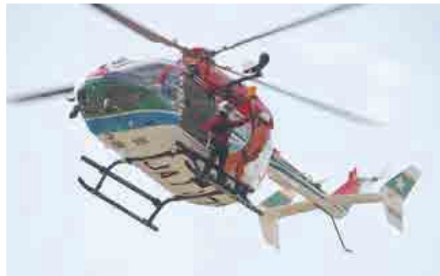
防災ヘリを使った隊員投入訓練

3月3日に南レク城辺公園で愛媛県消防防災航空隊と愛南町消防本部が合同訓練を実施しました。これは愛媛県消防防災ヘリコプター応援協定に基づい