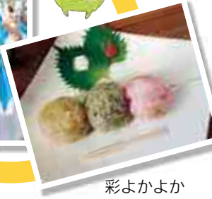
彩よかよか 三色おにぎり