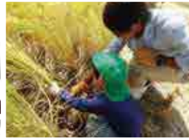
保育園児との 田植え、収穫