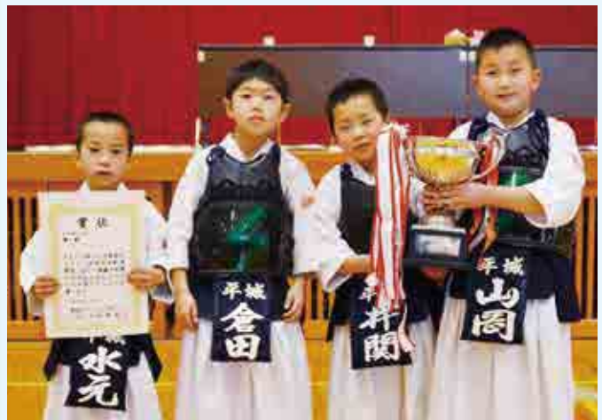
団体戦 低学年の部 優勝 平城剣道会