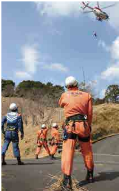
要救助者を収容した後、隊員を回収する防災ヘリ

て、双方が救助活動に必要な知識や技術を習得する目的で行ったもので、この日は、防災ヘリから隊員を投入回収する訓練や想定救急救助訓練を実施しました。