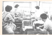
納屋での鯉の ばらぬき作業風景

ばらぬき唄（骨抜き唄） ハアー 大漁大漁が三年つづきや ハアーヨイヨイヨイヨイ 深浦港は花さかり ハアーヨイヨイヨイ ハアー 沖の鯉じゃわしやなけれど ハアーヨイヨイヨイ さまに釣られて抱かれない ハアーヨイヨイヨイ ※一部抜粋（即興も含め様々です）