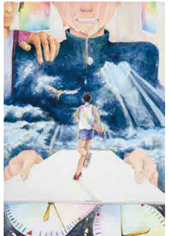
第28回読書感想画中央コンクール受賞作品 主催：(公社)全国学校図書館協議会、毎日新聞社 実施都道府県学校図書館協議会

中心に描かれたのは最終区を任された社会人ランナー。実業団に所属するベテラン選手ですが、目立った成績が残せず、日の当たらない競技人生を歩んできました。