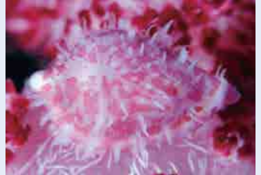
テンロクケボリガイ

桜の便りも聞かれ、普段は目立たない山桜もここぞとばかりに存在感を示している。海から眺める岬の山桜は、私の好きな愛南の風景の一つである。