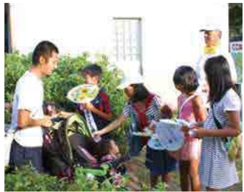
小学生が参加した街頭啓発

愛南町では、広報パレードや小中学校での学習会、作文コンテストの応募、各種の啓発活動などを行っています。皆さまのご理解とご協力をお願いします。