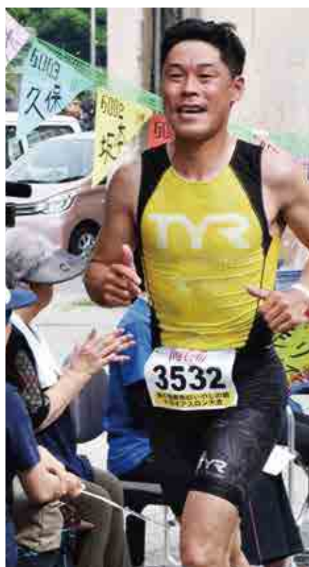
最後の競技ラン。沿道に飾られた応援旗が力を振り絞って走る選手の背中を押します

最後の力を振り絞って走る選手に沿道からの絶え間ない声援が送られます。そのコース沿いでひととき目を引く万国旗。よく見ると国旗ではなく、色紙には選手一人ひとりの名前が書か