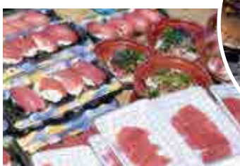
クロマグロの刺身、握り寿司など