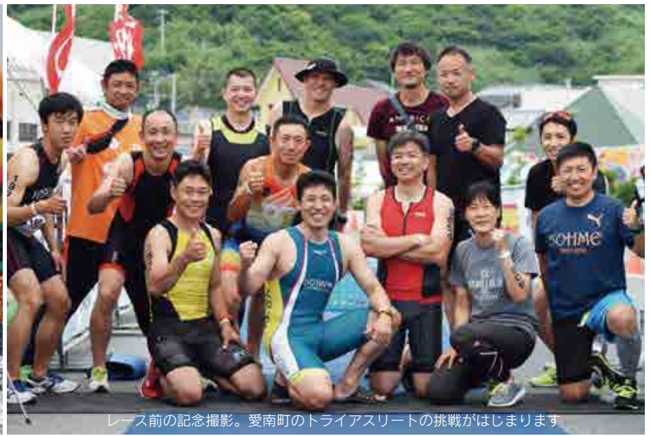
レース前の記念撮影。愛南町のトライアスリートの挑戦がはじまります