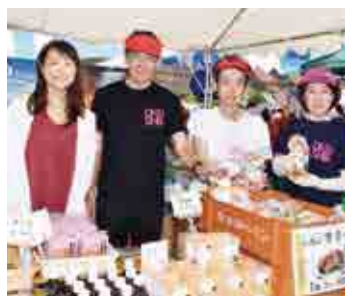
篠山市から出店した皆さん