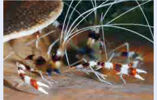
オトヒメエビのペア

7月になると県内でも海開きのニュースが聞こえてくるようになる。鹿島周辺にはカラフルなサンゴが多く、ダイバーの間では竜宮城にたとえられることも多い。