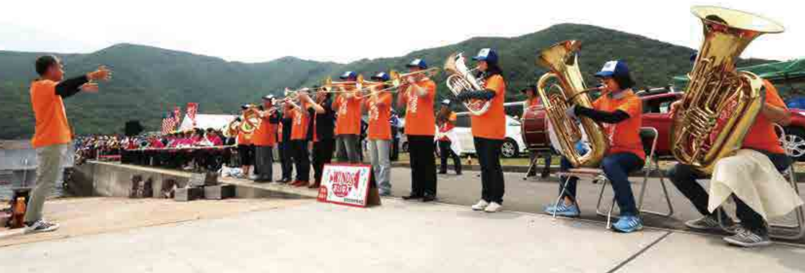
この大会のために準備したオリジナルファンファーレを披露。スタート前の選手を鼓舞し、会場を沸かせます