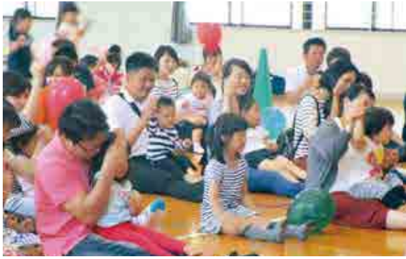
「おやこであそぼう」に参加した親子