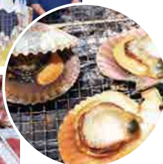
ヒオウギ貝の浜焼き