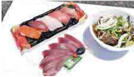
カツオの刺身、カツオ丼など