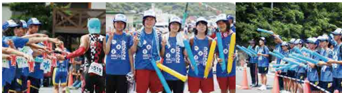
大会を支える学生ボランティアは、いやしの郷トライアスロン大会の風物詩。沿道からの声援が選手の大きな力になっています