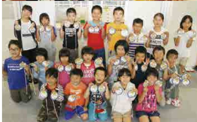
上/完走した選手にメダルを贈るタイレッドに扮した船越小学校の児童 下/船越小学校では全校児童21人が約1か月かけてメダルを完成させました

船越小学校では、毎年完走した選手に手作りのメダルを渡しています。今年も大会に向けて約1か月前から制作を始め、全校児童21人が370個のメダルを作りました。