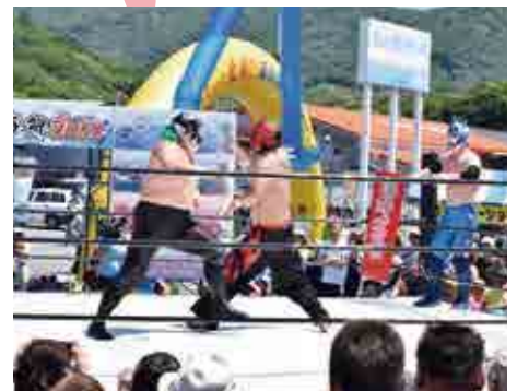
迫力のある海鮮プロレス

本イベント初登場となった「海鮮プロレス」や、愛媛大学の学生による「ぎょしょくビンゴ」、ご当地キャラが勢ぞろいするショーなども行われ、来場者を楽しませました。