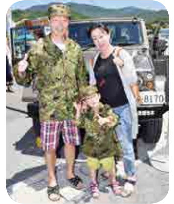
ジープの前で記念撮影