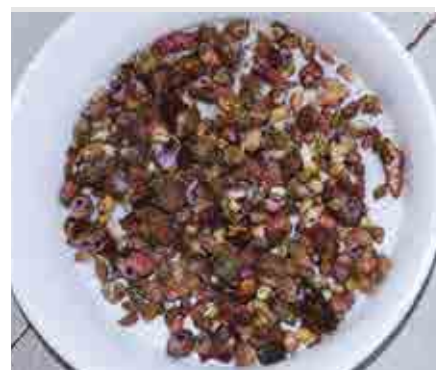
サンゴ食巻貝（シロレイシガイダマシ類） 注意深く観察するとさまざまな種類があります