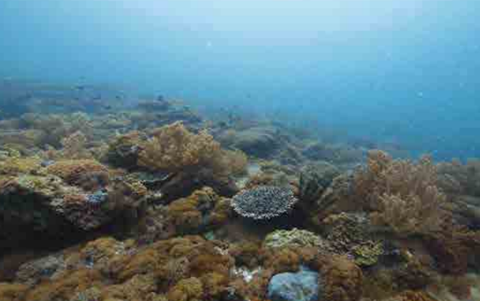
横島周辺は美しい海が広がり、スキューバダイビングの人気スポットにもなっています