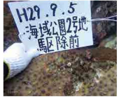
サンゴ食巻貝の駆除の様子。プレートの手前にサンゴに付着した貝が確認できます

潜水作業中に事故が起きないよう、ダイバーは二人一組で行動します。潜水している間、船主や協議会の事務局職員はダイバーの呼吸から生じる泡を追います。ベテランのダイバーであっても、海中の景観は変化が少ないため、方角を見失う可能性があるからです。作業海域から離れてしまわないよう、またダイバーに異変がないかを確認するために注視しています。 海中での作業を終えて港に戻ると、ダイバーの一人がモニタリング（観察・記録）を行います。サンゴの状態や海中の様子を記録し、今後の保全活動に役立てるため、平成27年度から取り入れました。