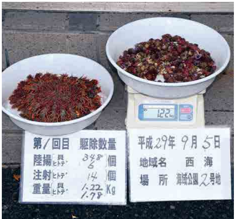
この日はサンゴ食巻貝を348個(1.22kg)、オニヒトデを20匹(陸揚げ6匹、注射14匹)駆除しました。ダイバーによると以前はこの海域ではオニヒトデがあまり見られなかったそうです

潜水作業中に事故が起きないよう、ダイバーは二人一組で行動します。潜水している間、船主や協議会の事務局職員はダイバーの呼吸から生じる泡を追います。ベテランのダイバーであっても、海中の景観は変化が少ないため、方角を見失う可能性があるからです。作業海域から離れてしまわないよう、またダイバーに異変がないかを確認するために注視しています。 海中での作業を終えて港に戻ると、ダイバーの一人がモニタリング（観察・記録）を行います。サンゴの状態や海中の様子を記録し、今後の保全活動に役立てるため、平成27年度から取り入れました。