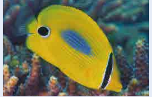
スミツキトノサマダイ

10月10日は目の愛護デーである。私事ながら、最近めつきりと老眼が進んでしまい、小さな文字が見えにくくなってしまった。目の大切さを改めて感じる今日この頃である。