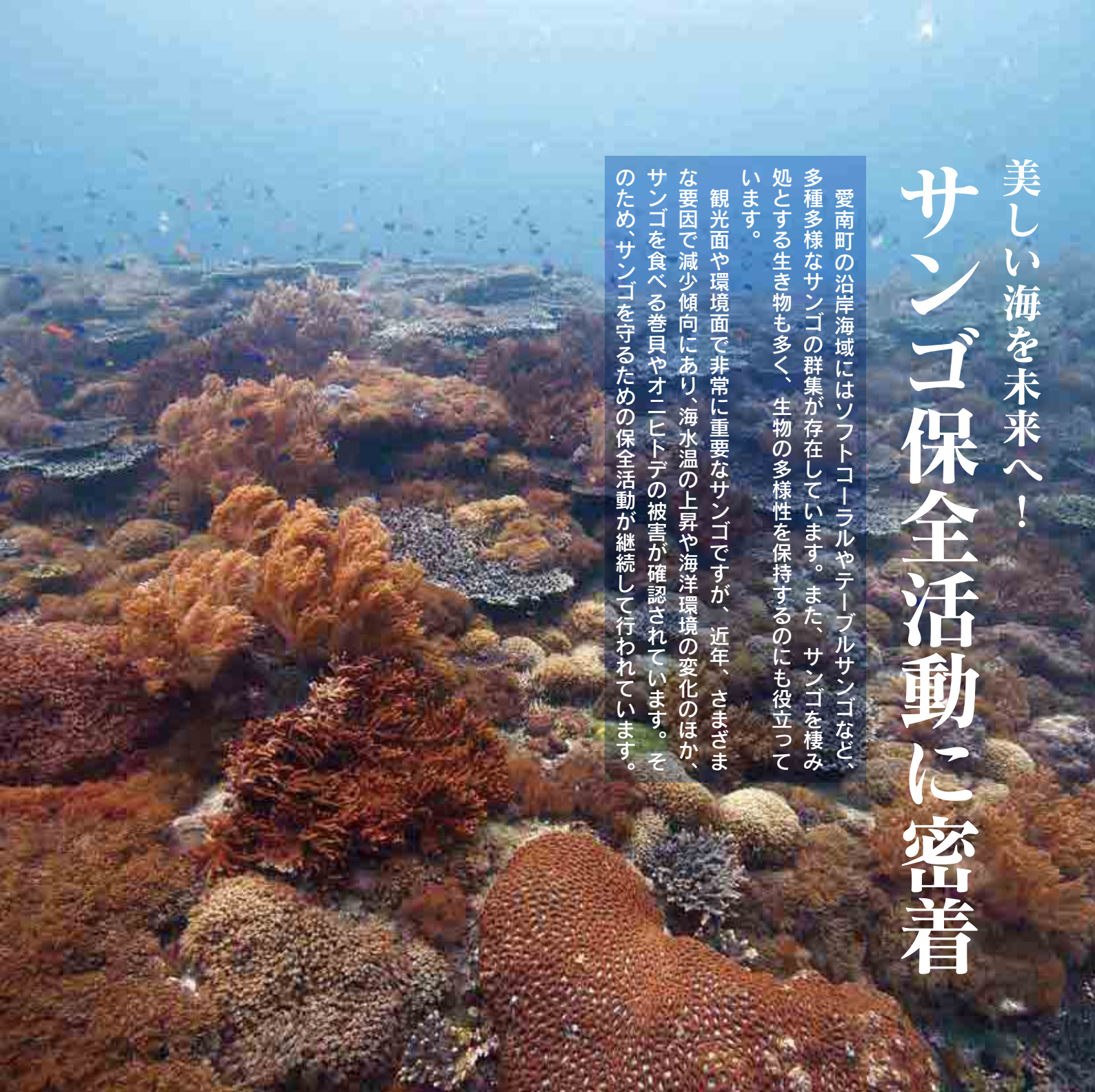
横島周辺の海中の様子

観光面や環境面で非常に重要なサンゴですが、近年、さまざまな要因で減少傾向にあり、海水温の上昇や海洋環境の変化のほか、サンゴを食べる巻貝やオニヒトデの被害が確認されています。そのため、サンゴを守るための保全活動が継続して行われています。