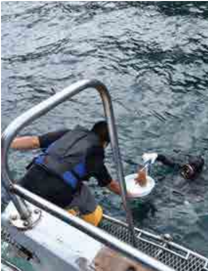
オニヒトデを陸揚げするダイバー。普段は注射による駆除が基本ですが、この日は報道取材があったため陸揚げしました。保全活動の周知も大切な仕事です