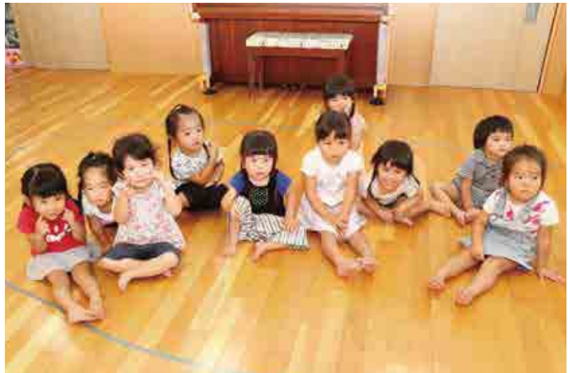
●はまゆう乳幼児保育所 さくら組女の子 はいポーズ!! プリンセスみたいにかわいいでしょ♡