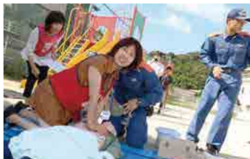
運動場で児童が倒れた状況を想定して、真剣に胸骨圧迫に取り組む教職員