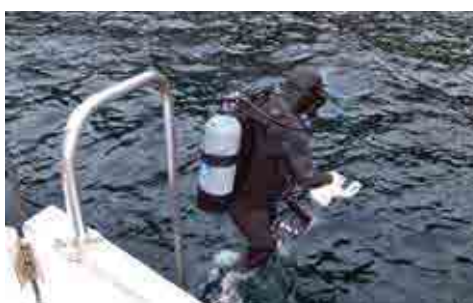
準備が整えば海中へ