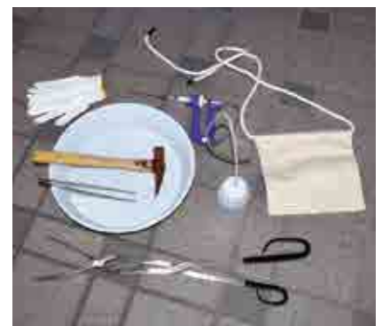
駆除用の備品一式