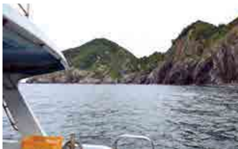
横島周辺海域に到着