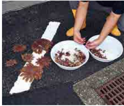
帰航後、協議会の事務局職員が手作業で巻貝を数えて計測します