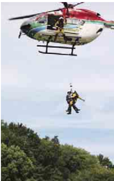
防災ヘリを使った隊員投入訓練