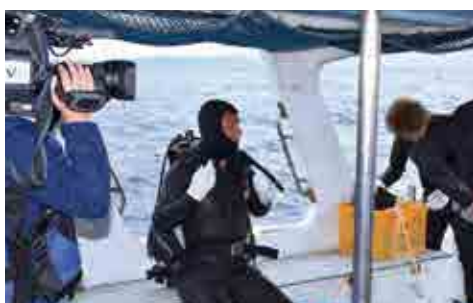
船上で入念に潜水準備を行います