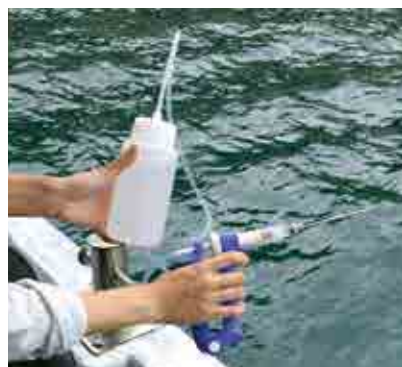
酢酸入りのボトルと注射器。1匹のオニヒトデに4〜8回ほど注射します