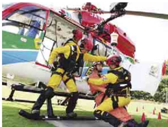
駐機訓練で隊員を回収する県消防防災航空隊

博隊長は「想定訓練では、無線連絡等で活動に対する連携が円滑にできたと思う。ヘリの特性である音と風を十分理解していただき、ヘリを有効に活用して私たちと共に人命救助にあたっていただきたいと思います」と話しました。