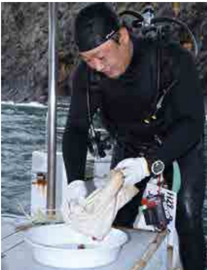
駆除して集めた巻貝はプレートへ