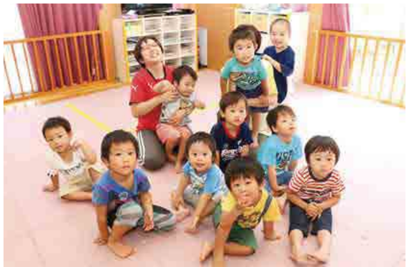
●はまゆう乳幼児保育所 さくら組男の子 男の子全員集合!! 元気いっぱい遊んでいます。