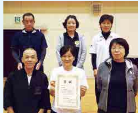
団体戦混合の部 B クラス優勝 浜っ子クラブ