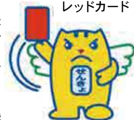
政治家の寄附はレッドカード

政治家が役員や構成員である団体が、政治家の氏名を表示して選挙に関し寄附をすると処罰されます。