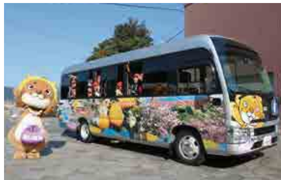
城辺小学校の6年生の校外学習でデビューしたプリントマイクロバス

大型プリンターで車体に直接インクを吹き付けてプリントすることで従来のラッピングに比べて費用を抑え、町の知名度アップが期待できるインパクトのある車体に仕上がりました。今後は町主催の事業等で町内外を走行して愛南町をPRします。