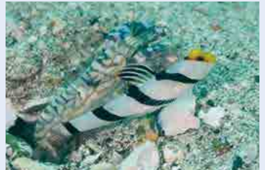
ネジリンボウとニシキテッポウエビ

歳末助け合い運動が行われる季節になってきた。互いに助け合って生きているのは人間だけではない。ハゼとエビの中には、人間が誕生する、はるか昔から助け合って生活しているものがいる。