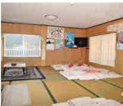
山洋渡船の無料仮眠所。 磯釣りのお客さんは予約して使用することができます