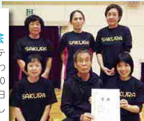
団体戦混合の部 A クラス優勝 SAKURA

第 17 回愛南町ラケットテニス大会が西海体育館で行われ A と B の 2 クラスに計 10 チーム 71 名が参加して、日頃の練習の成果を競いました。