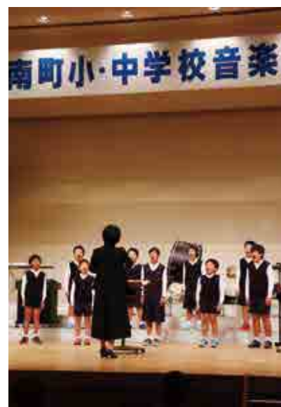
来年3月に閉校する中浦小学校は合唱「小さな勇気」で美しい歌声を響かせました