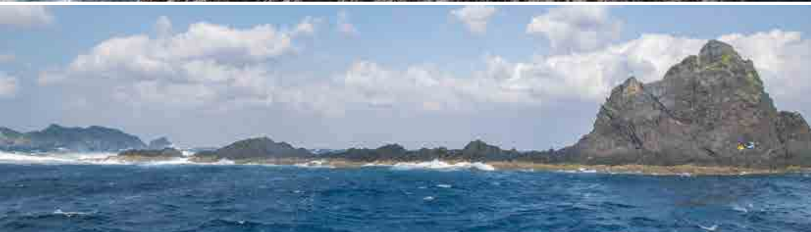
一級磯と呼ばれるナガハエ。切り立った地形が特徴です