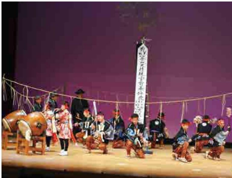
オープニングを飾った「正木の花とり踊り」

会場内には文化協会員の作品が数多く展示されたほか、文化センターではとんぼ玉のネックレス作りやフラワーアレンジメントなどのワークショップ、平城交流センターでは短歌大会や囲碁大会も開催され、訪れた人を楽しませました。