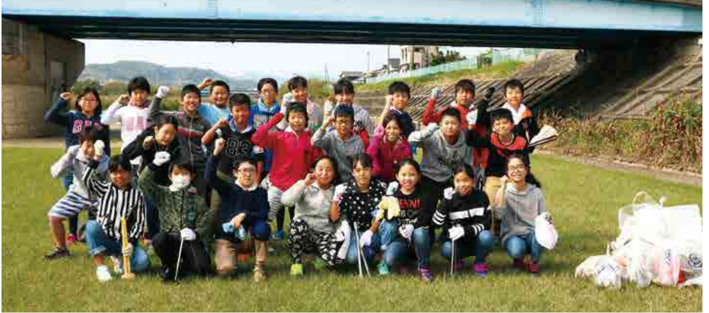
僧都川の河川敷でゴミ拾いを行った平城小学校5年1組の皆さん