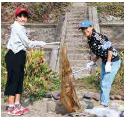
川底に埋まっていたビニール袋を拾う児童