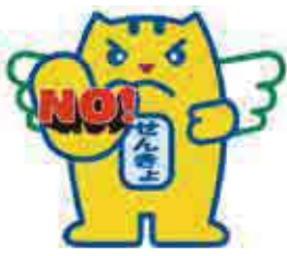
贈らない・求めない・受け取らない