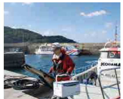
この日は風が強く午後1時過ぎに帰港。 通常は午後2時頃に納竿となります