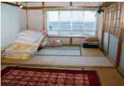
イシダイ、タマミ、グレ、ヒラマサ… こだま渡船の各部屋には魚の名前が使われています