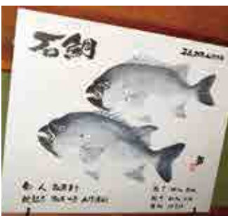
山洋渡船に飾られてる魚拓。 70cm近い石鯛が目を引きます