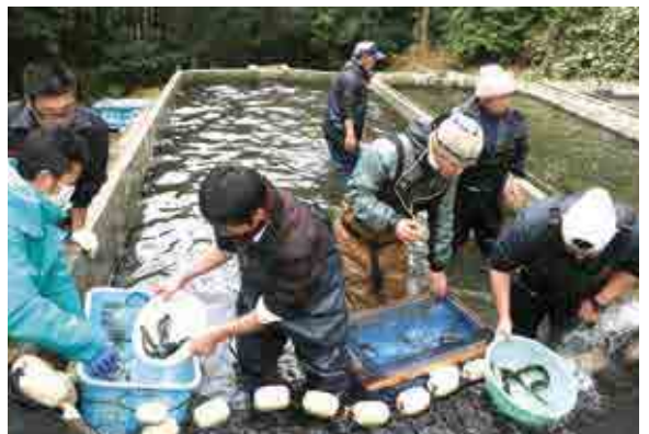
アマゴを山出の養殖場から御荘湾に移す作業を行う関係者