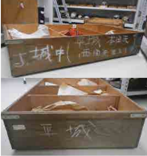
新潟大学医学部での保管状況（一部）

その後、骨から年代を測定したり、当時の食性が復元できる研究が進み、本年度、国立歴史