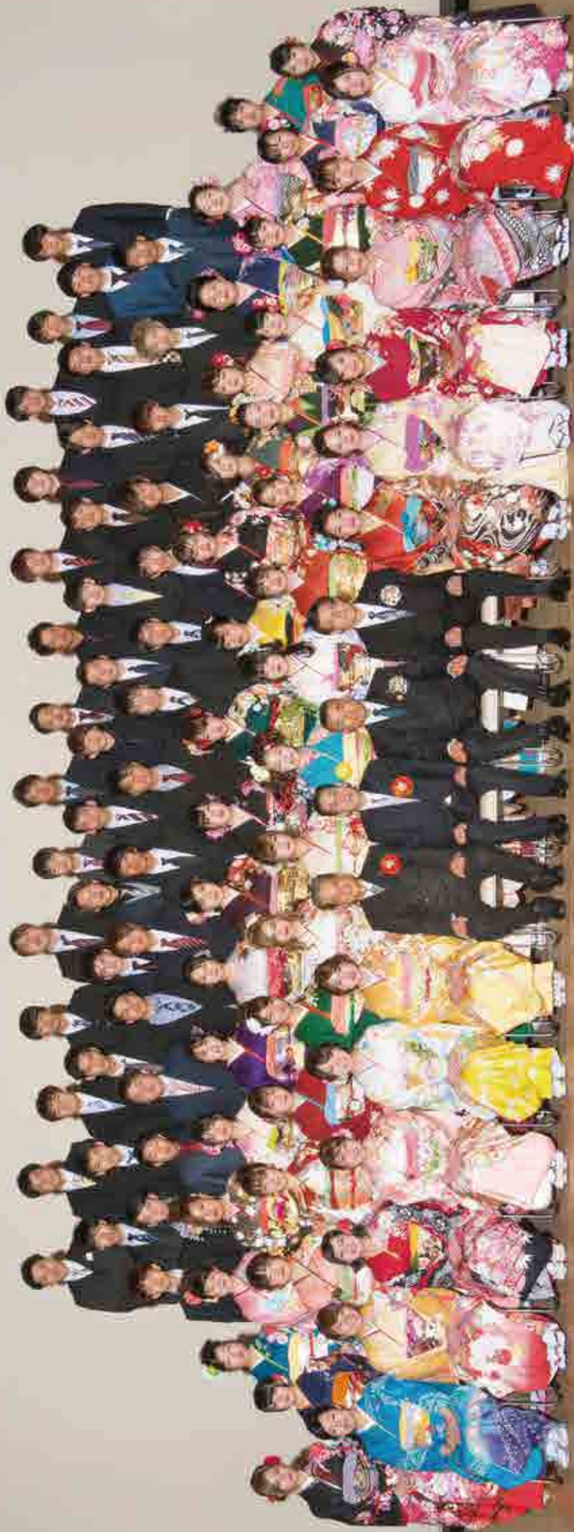
祝 愛南町成人式 於 御莊文化センター 平成30年1月3日