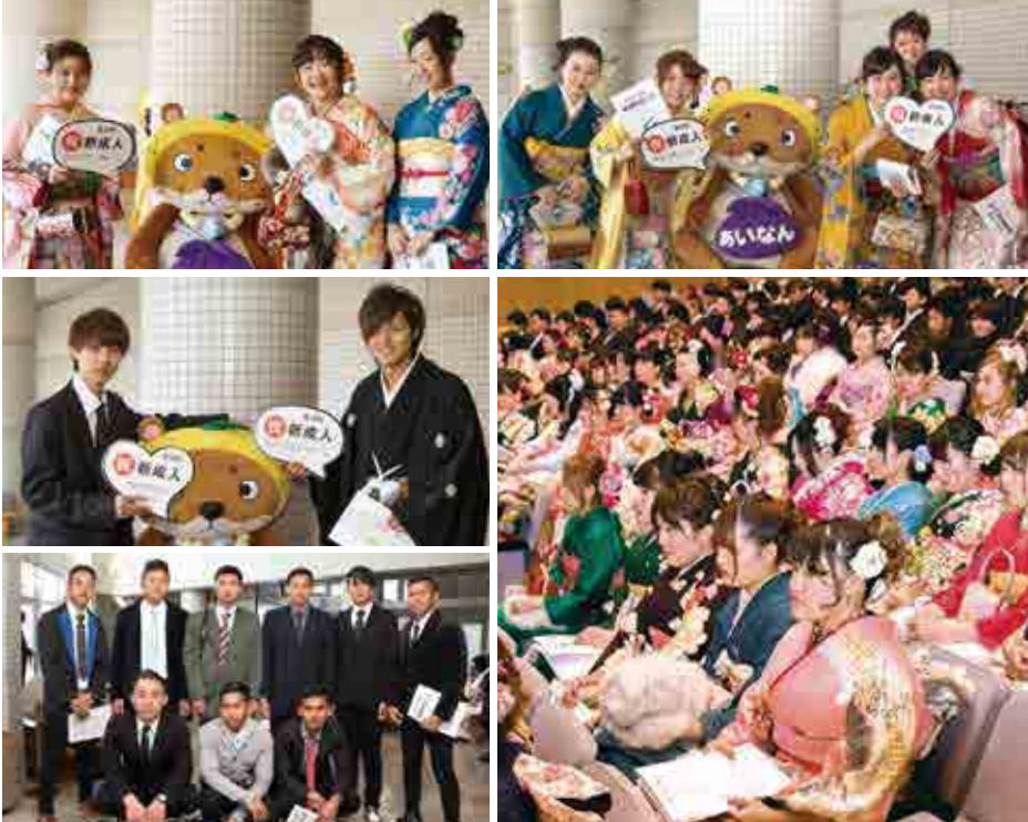
再会を祝い笑顔を見せる新成人。今年は初めて町内で漁業実習を行うインドネシアの実習生も参加しました（写真左下）

1月3日、御荘文化センターで平成29年度愛南町成人式が行われ、対象者270人中214人（男性112人、女性102人）の新成人が参加して成人としての決意を新たにしました。