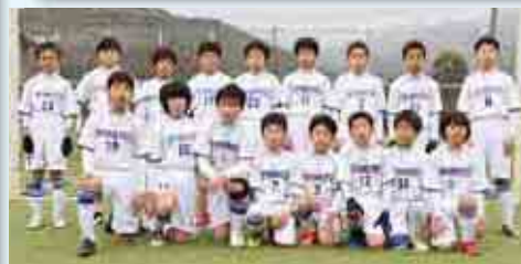
優勝 一本松少年サッカークラブ・I（写真前列） 準優勝 一本松少年サッカークラブ・S（写真後列）