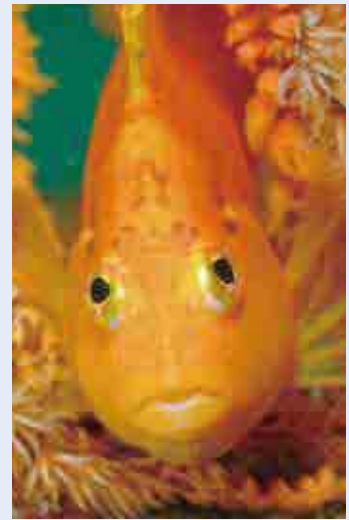
ウミウチワに住むオキゴンベ

愛南サンゴを守る会が今年で結成 5 年目を迎える。それを記念して、今月から数回に分けてサンゴを住処にしている魚たちを紹介したい。