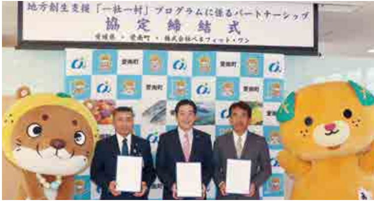
写真左から、清水雅文愛南町長、中村時広愛媛県知事、白石徳生代表取締役社長

ワンが有する情報通信技術や経営資源を活用し、愛南町の観光資源や特産品の販路拡大、U・I・ターン者の働く場の創出などについて愛南町を支援する内容となっております。