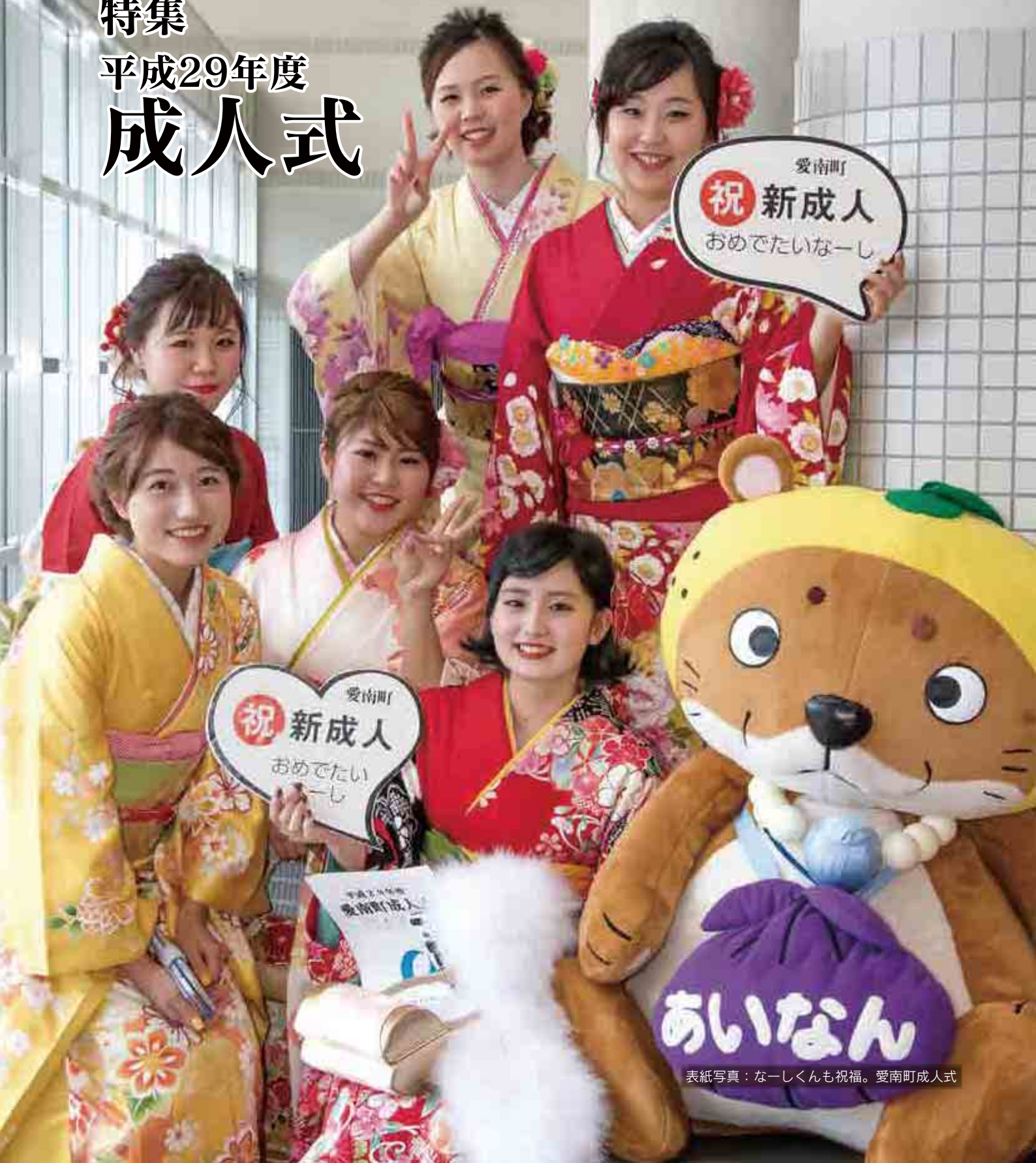
表紙写真：なーしくも祝福。愛南町成人式