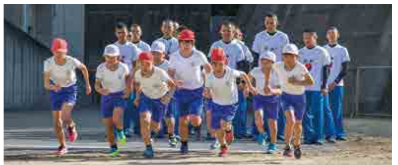
運動場を一斉にスタートする中浦小学校の児童