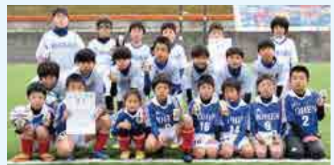
優勝 城辺少年サッカークラブ（写真前列） 準優勝 平城 SC・A（写真後列）