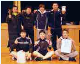
優勝 南宇和クラブ