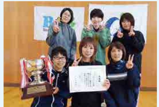
1部優勝 ヴィアンカ