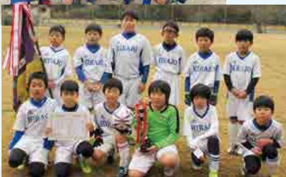
2部優勝 平城 SC