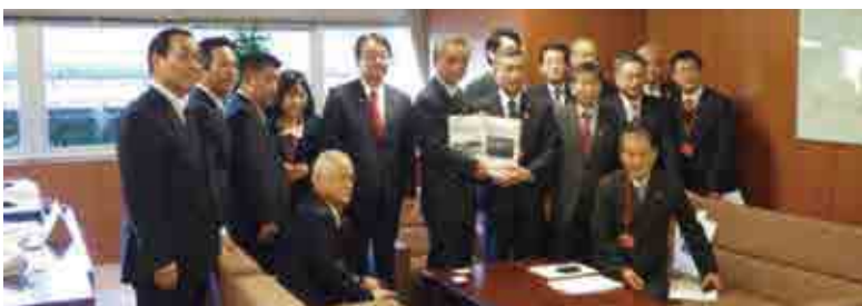
高橋克法国土交通大臣政務官(中央)に要望書を手渡す清水雅文愛南町長、(写真左側から)中西哲参議院議員、高野光二郎参議院議員、井原巧参議院議員、山本公一衆議院議員、多田佳代さん、山本順三参議院議員、(写真右下)宮下一郎愛南町議會議長 ほか7名