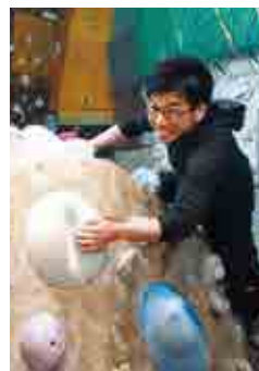
今年は初めてボルダリング体験ができる展示ブースが出されます

愛南町ボランティア連絡会（ボラ連）には、現在、賛助会員を含めて13団体が加盟し、地域に根ざしたボランティア活動を続けています。ボラ連の活動の柱となっているのが、地域交流センター「プラザじょうへん」の運営管理と「げんき市」の開催です。「げんき市」は、「プラザじょうへん」周辺の空き店舗を、ボランティア活動の発表や交流展示の場として活用することで、街の元気を集め、楽しいスポットを作り上げて、町の活性化につなげようと、いまから14年前