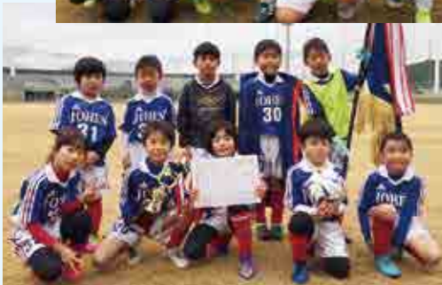
3部優勝 城辺少年サッカークラブ