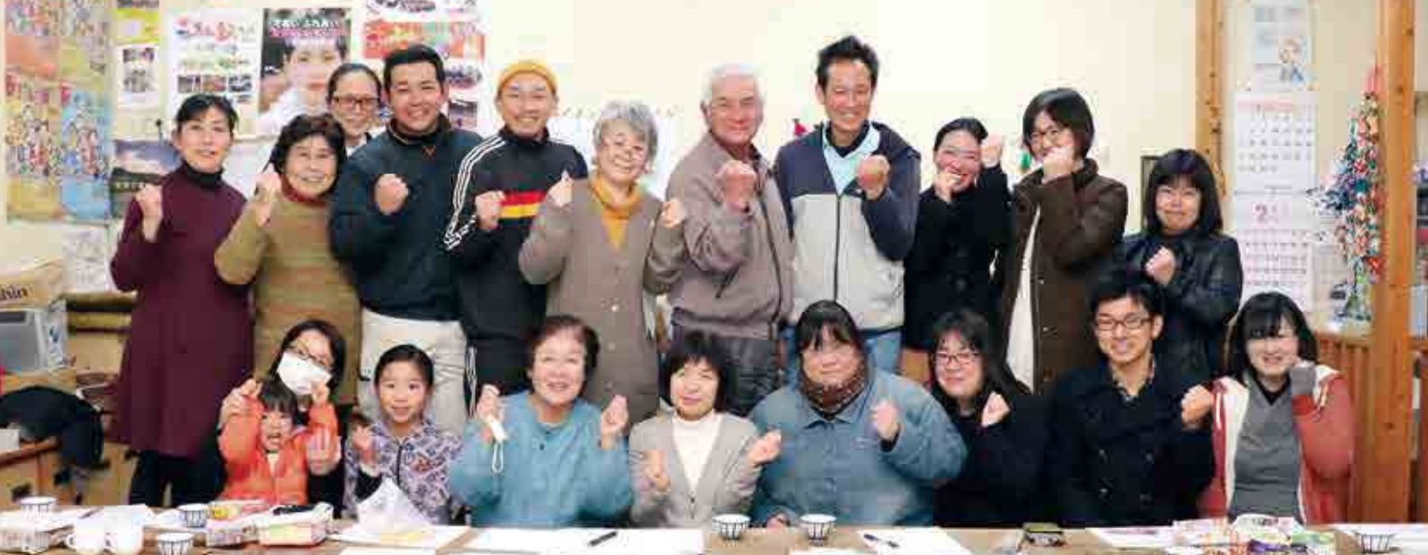
「げんき市」プロジェクト会議のメンバー。ボラ連に加入している団体のほか、出店したり展示ブースを出す人たちが集まって準備を進めています