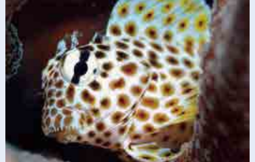
ミドリイシに住むセダカギンポ

ミドリイシは愛南町にも多く生息しているサンゴの仲間である。多くの人がサンゴと聞いてイメージするのが、このミドリイシの仲間である。緑色をしていて、石のように固いから、この名前がついている。木のようにも見えるので、枝サンゴと呼ばれることもある。