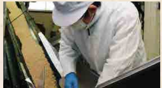
▲種付けして麦麴となったものを大豆や塩と混ぜ合わせ、熟成させることで麦みそができあがる