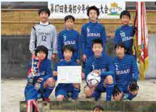
1部優勝 平城 SC・A