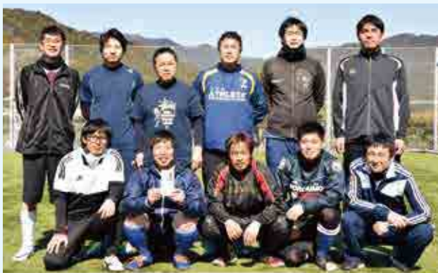
優勝 一本松倶楽部