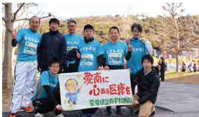
南宇和病院職員一同は、いつの日か、地域医療に対する熱い思いが報われることを信じて、日々頑張っています

当日は晴れたものの、冷たい風が吹き、日中の気温も1～2℃台という厳しい寒さの中、出場した職員は、背中に「愛南に心ある医療を」と書かれたおそろいの水色のTシャツを着て、愛南町の地域医療の窮状を県民の皆さんに少しでも知ってもらいたいという熱い思いを背負って、42.195kmを走りました。