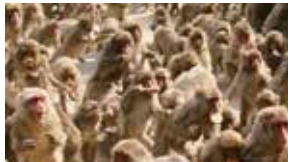
高崎山自然動物園

大分市の歴史を語る上で外せないのは、豊後の英傑・大友宗麟公です。今から約450年前の戦国時代に、名門大友家の第21代当主として北部九州6カ国を治めるとともに、ヨーロッパとの積極的な交流により南蛮文化を花開かせました。今でも、宗麟公ゆかりの史跡や寺社仏閣が多数現存しています。