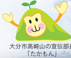
大分市高崎山の宣伝部長 「たかもん」

大分市は、緑豊かな山々と海や川に恵まれるとともに、九州第1位の製品出荷額を誇る製造業を中心に、様々な産業が集積する県都であり、九州各都市への繋がる鉄道や高速道路、関西・四国方面への海上交通が充実するなど交通結節機能が充実した都市でもあります。