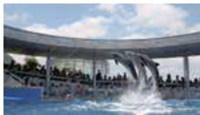
大分マリンパレス水族館 『うみたまご』