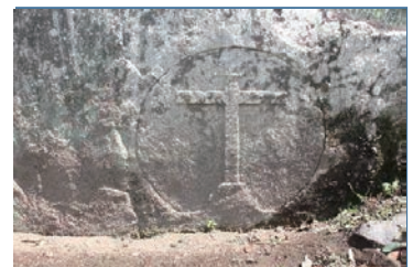
▲寺小路磨崖クルス