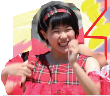
鳳凰グループ応援副団長

私たち鳳凰グループのテーマは「多様性」でした。それを表現するため「和」をイメージした演舞や洋楽などを取り入れグループの特徴である「多様性」を表現しました。コロナ禍で無観客となってしまった体育祭だからこそ、私たちはなぜ体育祭で応援合戦をするのか考えました。「体育祭で優勝したい!」という気持ち以上に「愛南町の明るい未来を応援したい!」という気持ちが大きかったです。私たちの応援を見て少しでも多くの方が笑顔になってくれるよう、元気を届けられるよう全員が笑顔でパフォーマンスすることを心掛けました。この思いが少しでも多くの人に届くとうれしいです。