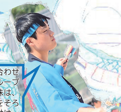
蒼龍グループ よさこいり

「よさこい」とは、「よさこい鳴子踊り」の曲に合わせて各グループがそれぞれ振り付けを一から考え、グループの1~3年生全員で踊る競技です。よさこいの醍醐味は、グループそれぞれの色が出るところです。皆で踊りをそるえるのが難しい分、グループが一体になった時の感動は、すばらしいものになります。ぜひ、南宇和高校に入学して、よさこいの楽しさ、感動を味わって見てください。