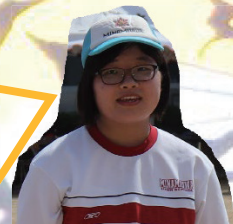
光虎グループ 立て看板リーダー