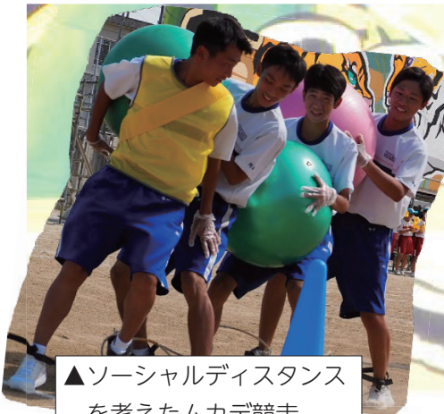
▲ソーシャルディスタンス を考えたムカデ競走

立て看板は、遠くから見るものなので、それを意識した色使い、構図にしようと心掛けました。また、原画や下絵を描く際にスマホやプロジェクターなど、デジタル機器を使用することで、効率的に作業を進めることができました。私は、中学校の頃も立て看板を制作しましたが、その時より格段にサイズが大きいのので、過去の立て看板を参考にしたり、第三者にアドバイスを求めたりするのはとても重要でした。作業自体は大変なことも多いですが、夏休みから集まって制作する楽しさや出来上がった時の感動を、多くの人に、ぜひ味わってほしいです。