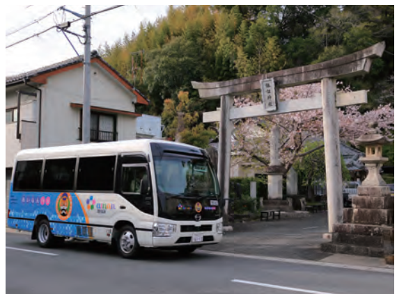
▲昨年度入賞作品(作品名:見守られて)