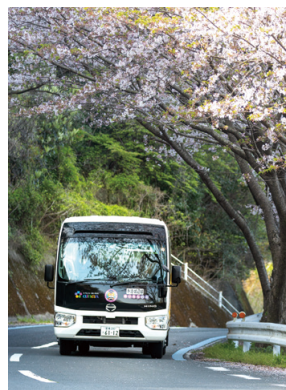
▲昨年度入賞作品(作品名:出発)