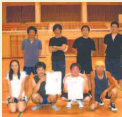
優勝 南宇和クラブB