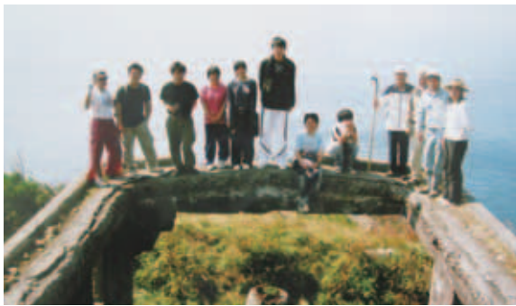
▲映画「日-hitsuki-月」の制作スタッフの皆さん