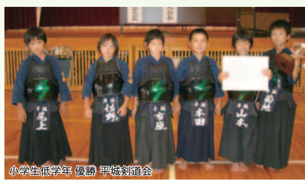
小学生低学年 優勝 平城剣道会