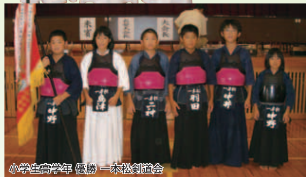
小学生高学年 優勝 一本松剣道会