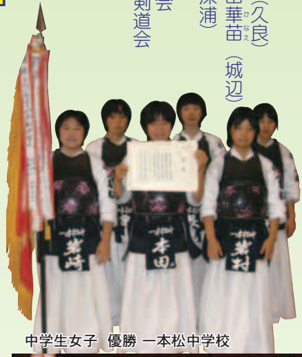
中学生女子 優勝 一本松中学校

本町選手も、全種目に参加し、好成績を収めることにも、新しい友との出会いを楽しんでいました。