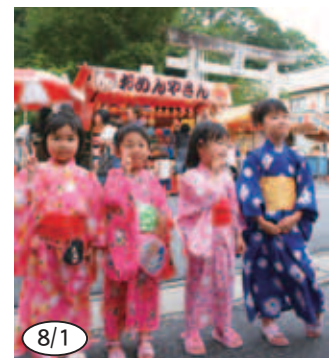
▲かわいい浴衣姿で「城辺夏まつり」を楽しんでいました