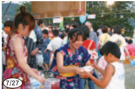
▲かわいい浴衣姿の子ピッコで賑わった「第21回御荘病院夏祭り」