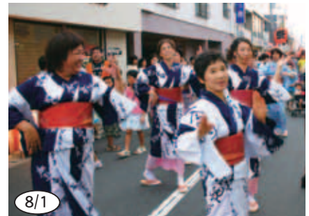
▲城辺夏まつりの踊り子の皆さん