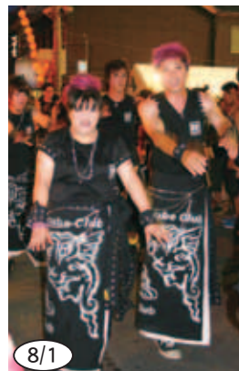
▲盛り上がった城辺サンパ踊り