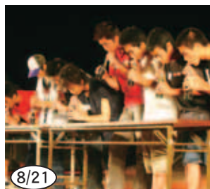
▲コーラ早飲み大会(御荘夏まつり)