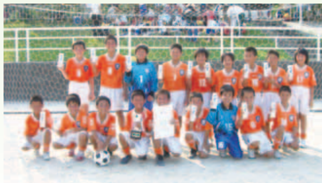
6年生以下の部優勝 素鷲サッカースポーツ少年団(松山市)