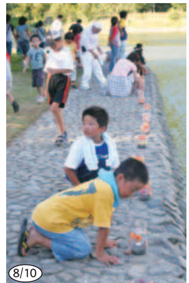
▲須ノ川公園に飾られたヒオウギ貝のキャンドルです