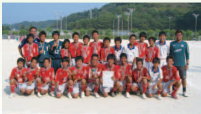
中学生の部優勝 南第二中学校サッカー部(松山市)