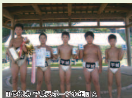
団体優勝 平城スポーツ少年団 A