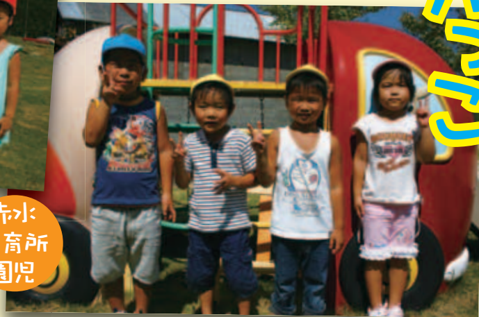
赤水 保育所 園児