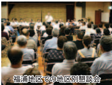
福浦地区での地区別懇談会