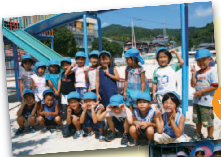
御荘 保育所 園児