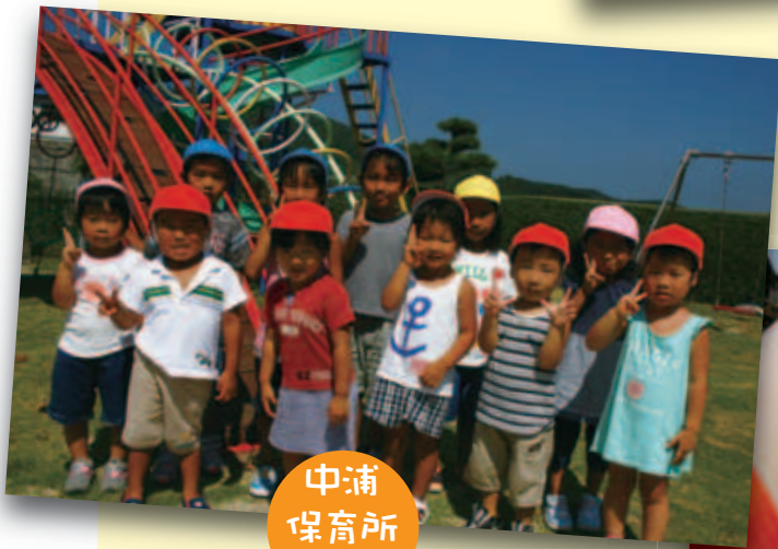
中浦 保育所 園児