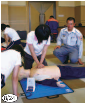
▲ AED の操作方法を学んだ講習会の様子です