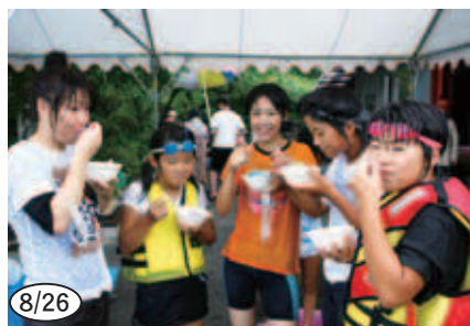
▲ 「ありんこくらぶ」のデイキャンプの様子です