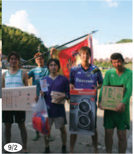
▲ 男子の部優勝「さくら」の皆さん