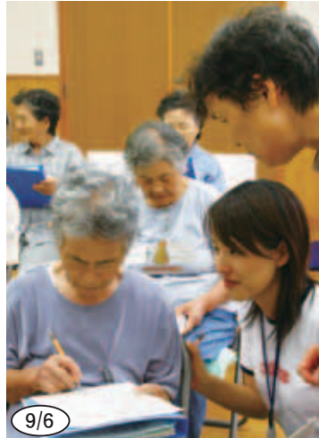
▲ 菊川地区での体力測定「ごきげんくらぶ」の様子です