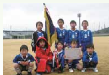
3部1位 一本松少年サッカークラブA