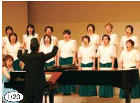
▲「第2回愛南コーラスフェスティバル」を主催した合唱団コスモスの皆さん