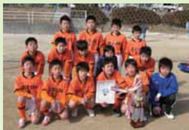
1部A 1位 平城SC