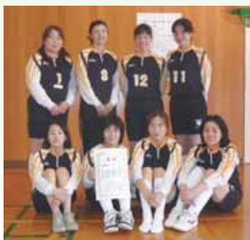
2位 インティー御荘