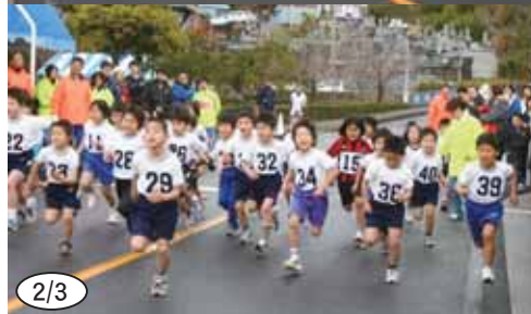
▲大声援を受け、全力疾走のスタート