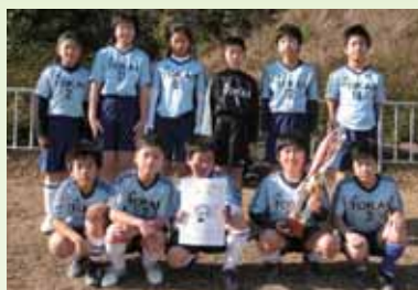
1部B 1位 東海・満倉連合