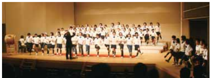
合唱劇で会場を盛り上げた平城小音楽部