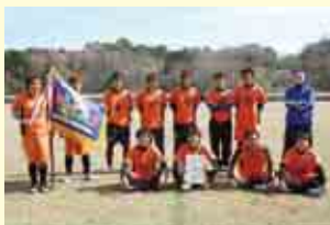
1部優勝 グーニーズ

【大会結果は次のとおり(優勝のみ掲載)】 1部(11人制) 優勝 グーニーズ 2部(9人制) 優勝 愛南町役場サッカー部 3部(9人制) 優勝 中ーマンション 4部(9人制) 優勝 FCクワランタ