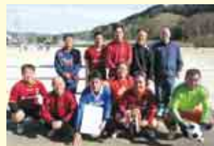
4部優勝 FCクワランタ