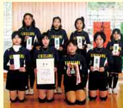
準優勝 菊川スポーツ少年団