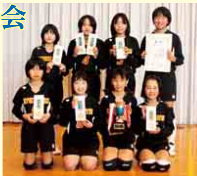
優勝 一本松バレーボールクラブA

優勝 一本松バレーボールクラブA 準優勝 菊川スポーツ少年団 3位 柏スポーツ少年団