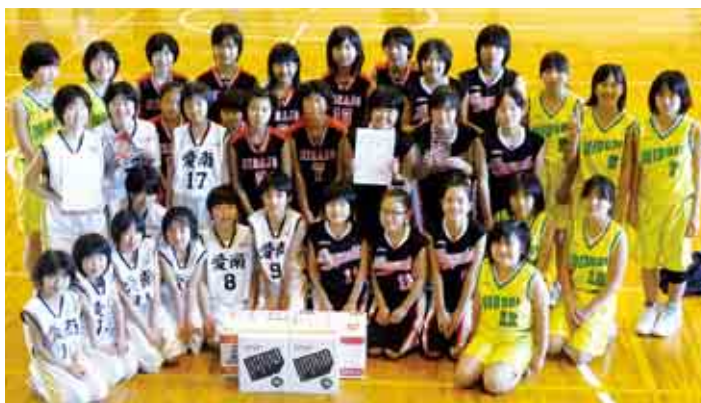
城辺小学校体育館で「第9回南宇和スポーツクラブ・ミニバスケットボール大会」が開催されました。優勝は愛南MBC、準優勝は久良MBCでした。(2/24)【P21参照】

御荘B&G海洋センタープールリニューアル記念式典の後、四国の海洋センター7団体から34名の選手が参加して「B&G会長杯四国ブロック水泳競技交流大会」が開催されました。(3/2)【P7参照】