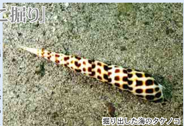
掘り出した海のタケノコ

出てくるのは薄汚れた二枚貝が多く、これは「はずれ」である。めったに出ない「当たり」の一つがタケノコガイの仲間である。写真のウシノツノガイは長さ15cmの立派なもので「大当たり」であった。海のタケノコはいったいどんな味がするのだろう。