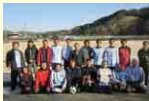
3部優勝 中ーマンション