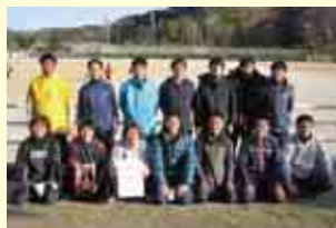
2部優勝 愛南町役場サッカー部