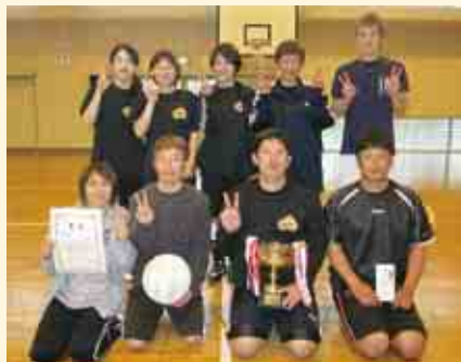
1部優勝 ぶぁブルス