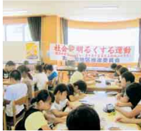
社会を明るくする運動 学習会

”社会を明るくする運動“とは、犯罪や非行の防止と罪を犯した人たちの更生について理解を深め、犯罪や非行のない地域社会を築くための全国的な運動です。