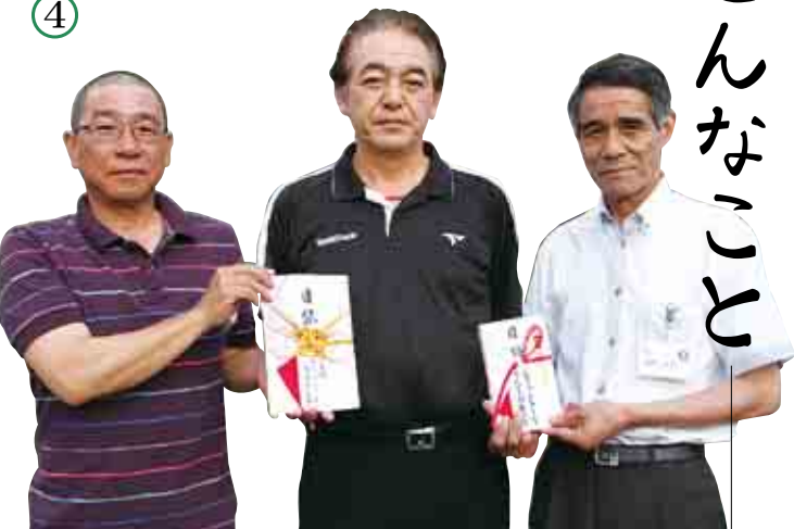
左から宮崎会長、福岡実行委員長、鼻崎教育長