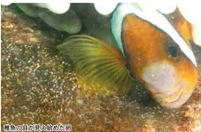
稚魚の目が見え始めた卵

大会には約150名のボランティアスタッフも参加し、3か所のチェックポイントで、カツオのタタキや愛南ゴールドの生搾りジュースなど愛南自慢の味を振舞って選手の疲れを癒しました。チェックポイントでは、「こんなに贅沢な大会はない」との声も聞かれ、選手の皆さんには愛南町の「お接待」を満喫してもらえたようでした。