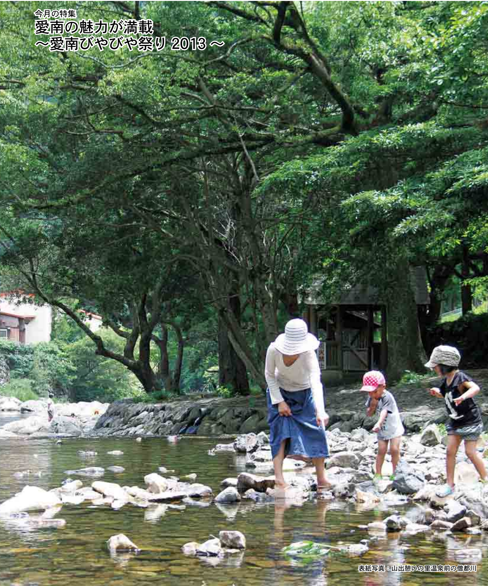
表紙写真：山出憩いの里温泉前の僧都川