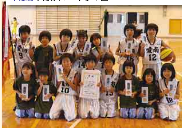
優勝 愛南 MBC