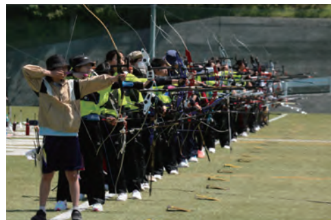
▲青空の下、集中して矢を放つ参加者たち