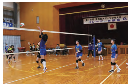
▲チーム一丸となりフレッシュなプレーを見せる選手たち