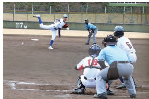
▲相手打線に立ち向かい全力投球

愛南町からは、3つの中学校（内海・御荘・城辺）で構成する合同チームが出場しました。1日目に保内中学校を破った選手たちは、勢いそのままに2日目の城東中学校にも勝利して見事予選通過を果たしました。選手たちの気迫のあふれるプレーに、仲間や観客から熱い声援が送られました。