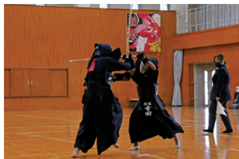
▲一進一退の攻防を繰り広げる剣士