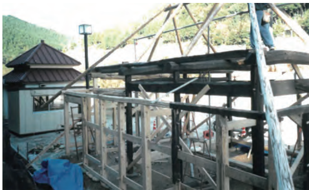
▲指定有形民俗文化財「チョウナづくりの家」 移設復元作業(白い材は全て新しい材)