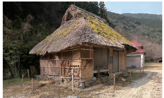
▲老朽化が著しい現在の様子

移設から現在に至るまでの建物の管理は、地元保存団体を経て町が維持管理を行ってきましたが、近年は屋根の風損に加え、雨漏りの深刻化など、今後の維持管理が困難な状況となっていました。