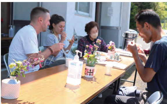
▲小山本村集会所でおもてなしを受けるお遍路さん

ゴールデンウィーク中の2日間、町連合婦人会一本松支部がお遍路さんへのお接待を実施しました。小山本村集会所と国道56号線沿いの2か所で、春の食材を使ったお弁当や河内晩柑のゼリーなどが振る舞われました。