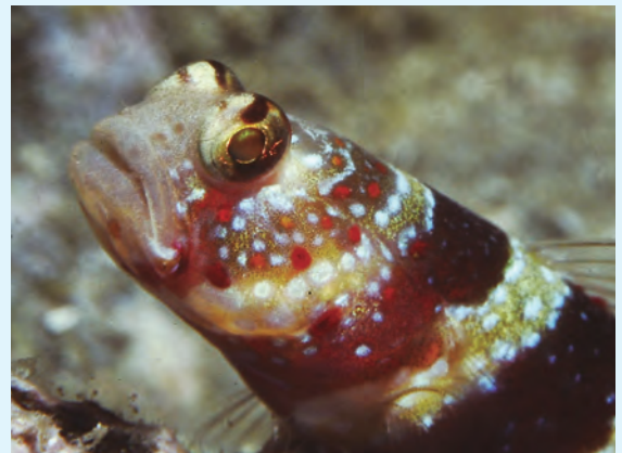
【見張りをするクビアカハゼ】

クビアカハゼは、名前の通り、首に赤色の帯がある。その周りに赤色・黄色・白色の派手な水玉模様が付いている。体長が6cmほどの小さなハゼの仲間で、テッポウエビの掘った巣穴に居候している。住まわせてもらう代わりに、エビが魚に襲われないように見張りをしている。穴を掘るのが得意なテッポウエビと、視力の良いハゼと