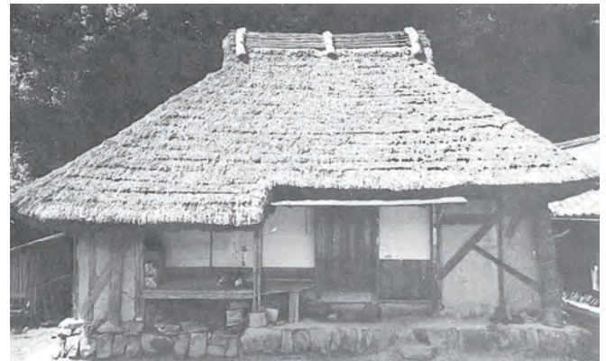
▲指定前のチョウナづくりの家(昭和30年代)

その後、平成16年2月に、当初の所在地の僧都から現在の山出に移設されましたが、この際に元々の建材の半数以上が新しい材に入れ替わって復元されています。