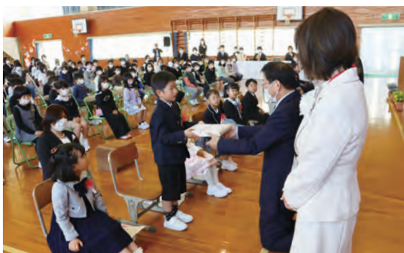
▲元気な声でお礼を言い教科書を受け取る新入生

4月10日(月)に町内9つの小学校で、4月11日(火)は町内5つの中学校で入学式が行われました。小学校では74人、中学校では115人の児童生徒が、新たな学校生活をスタートしました。