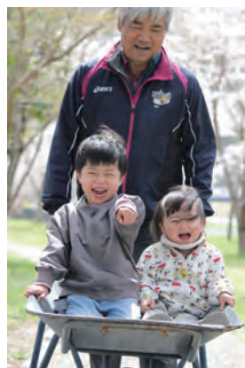
小・中・高校生の部知事賞▶ 「団子親子」