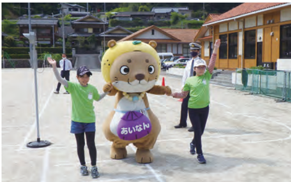
▲なーし君と一緒に横断歩道の渡り方を再確認する児童生徒たち

高知県との県境に位置する篠山小中学校で、交通事故を防止するための交通安全教室を開催しました。この教室は、愛南警察署、宿毛警察署、南宇和交通安全協会などが合同で毎年開催しているもので、両市町のマスコットキャラクターと一緒に楽しく交通ルールについて学びました。