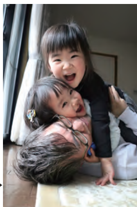
◀一般の部知事賞 「また乗せてね♪」