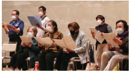
◀合唱団コスモスの練習に励む2人